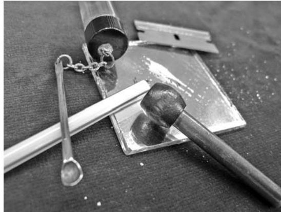
Abb. 1 Oben ein Glasgefäß für Kokainpulver mit Schraubverschluss, an dem ein Portionierungslöffelchen hängt. Auf der Spiegelfläche eine „Line“. Darunter, zum Inhalieren: ein Strohhalm und ein Röhrchen mit Holznuss, die das Nasenloch beim Inhalieren abdichtet.

Kokain ist ein sehr wirksames Lokalanästhetikum, führt zu einer Verengung der Blutgefäße und besitzt starke psychotrope Effekte. Neurochemisch hemmt