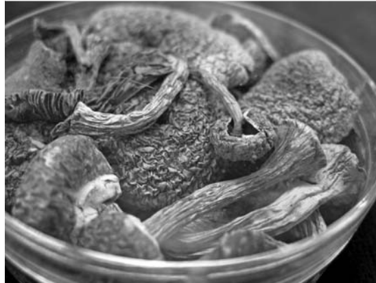
Abb. 3 Das Indolalkaloid Psilocybin kommt in einigen Pilzarten vor – insbesondere in der Gattung Psilocybe. Das Foto zeigt getrocknete „Magic Mushrooms“, deren Wirkung der des LSD ähnelt (Quelle: Thieme Verlagsgruppe).

Ein physisches Abhängigkeitspotenzial ist nach heutigem Wissenstand für Halluzinogene nicht beschrieben.