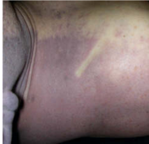
Abb. 2 Bis ca. 10 Stunden nach dem Tod lassen sich die Totenflecke wegdrücken.