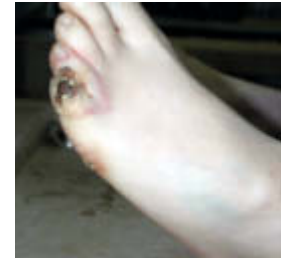
Abb. 6 Im Fall des plötzlichen Todes einer Bäuerin bei der Arbeit wurde zunächst ein natürlicher Tod bescheinigt. Erst bei der zweiten Leichenschau wurde die Leiche entkleidet. Es fand sich eine Strommarke am Fuß, sodass unter Berücksichtigung der Fallumstände von einem Unfalltod auszugehen war und die Angehörigen der Verstorbenen Ansprüche bei einer Unfallversicherung geltend machen konnten.

Todeszeitschätzung | Der Gesetzgeber sieht vor, dass sich der leichenschauende Arzt zur Todeszeit äußert. Zur Eingrenzung kann die Phänomenologie der sicheren Todeszeichen (▶ Tab. 1 ) herangezogen werden.