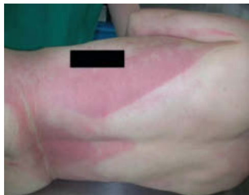
Abb. 3 Hellrote Totenflecke bei Kohlenmonoxidvergiftung.

Flecke richtig unterscheiden | Ein genaues Hinschauen verlangt u.U. auch die Unterscheidung