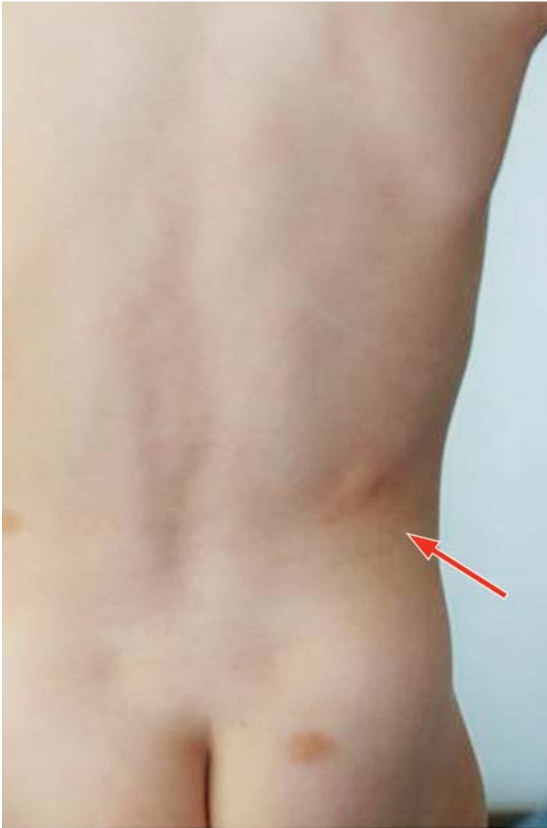
Abb. 9 Mastozytose. Am Stamm gelblich-bräunliche kutane Knoten mit positivem Darier-Zeichen (Pfeil).

makulo-papulöse kutane Mastozytose (Urticaria pigmentosa) sind die häufigsten Manifestationsformen im Kindesalter; beide können gelegentlich mit einer Blasenbildung einhergehen. Typisch ist das Darier-Zeichen (Abb. 9) [4].