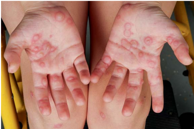
Abb. 6 Erythema exsudativum multiforme. Typische targetoide Läsionen palmar.