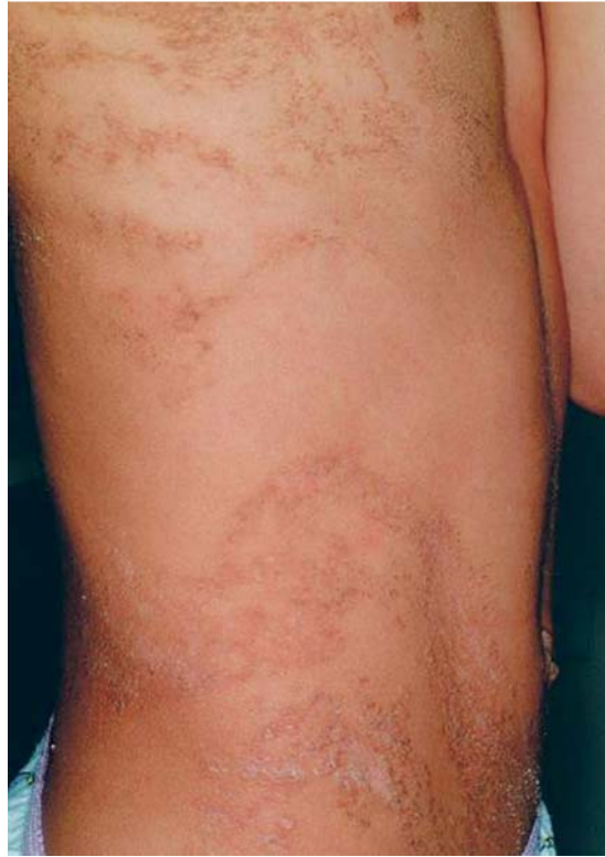
Abb. 10 Epidermaler Nävus. Am Stamm und linear entlang der Blaschko-Linien angeordnete bräunliche hyperkeratotische Papeln.

Therapeutisch kann ggf. eine ablativ Lasertherapie in Erwägung gezogen werden.