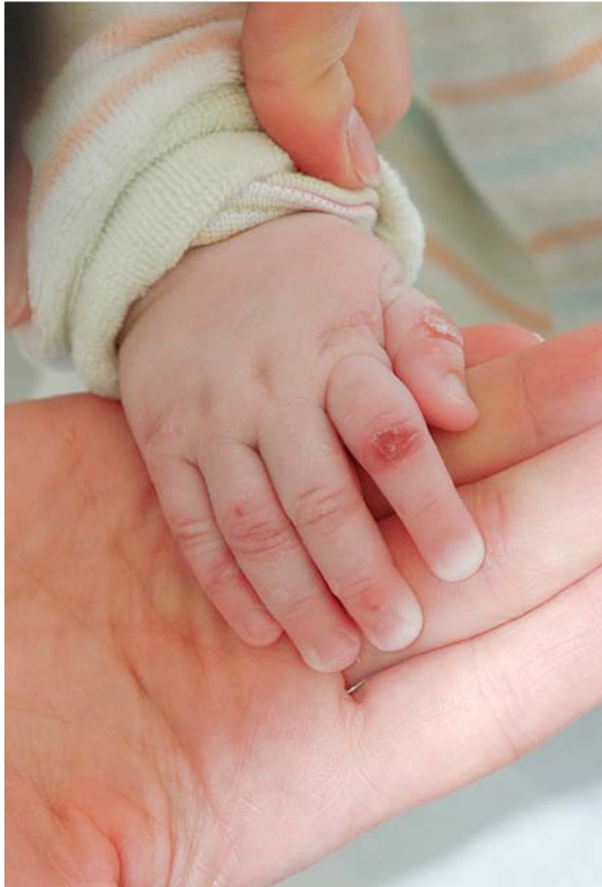
Abb. 11 Epidermolysis bullosa. Blasen und Milien bei einem Mädchen mit EB simplex.