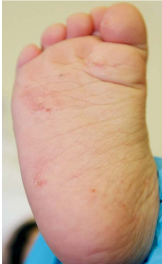
Abb. 5 Skabies. Zu sehen sind die plantar multiplen Gänge. Eine palmo-plantare Beteiligung wird oft im Rahmen einer Skabies insbesondere bei Kindern, der Hand-Fuß-Mund-Erkrankung, Syphilis und dem Erythema exsudativum multiforme (Abb. 6) beobachtet.

Das Erythema exsudativum multiforme ist eine akute selbstlimitierende Dermatose mit kokardenförmigen Effloreszenzen (Abb. 6). Diese tritt bei Kindern meist