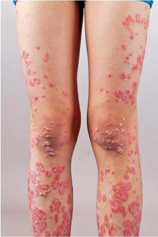
Abb. 4 Psoriasis. An den Streckseiten der Extremitäten finden sich scharf begrenzte erythematöse Papeln und Plaques mit grob lamellärer silbriger Schuppung. Die Streckseiten der Extremitäten, der Haaransatz und die Ohrgänge sind typische Prädilektionsstellen für die Psoriasis. Zusätzlich können die Rima ani (Psoriasis inversa) und die Nägel (Tüpfelung, Ölflecken) befallen sein.

v. a. geprägt durch nächtlichen Juckreiz. Die papulovesikulären Hautveränderungen sind meist Ausdruck einer allergischen Reaktion des Organismus auf die Milbeninfektion (Id-Reaktion). Die Hautveränderungen sind v. a. in den Interdigitalfalten der Hände, Füße, Ellenbeugen, Kniekehlen sowie im Brustwarzenhof, Nabel und im Genitalbereich lokalisiert. Bei Säuglingen und Kleinkindern sind die Effloreszenzen oft palmar/plantar (Abb. 5) und an der Kopfhaut lokalisiert. Die Therapie erfolgt mit Permethrin 5% in einer Cremegrundlage, ggf. muss die Therapie nach 14 Tagen wiederholt werden (der Kopf muss mitbehandelt werden!). Differenzialdiagnostisch muss man an ein Ekzem bzw. eine Impetigo denken.