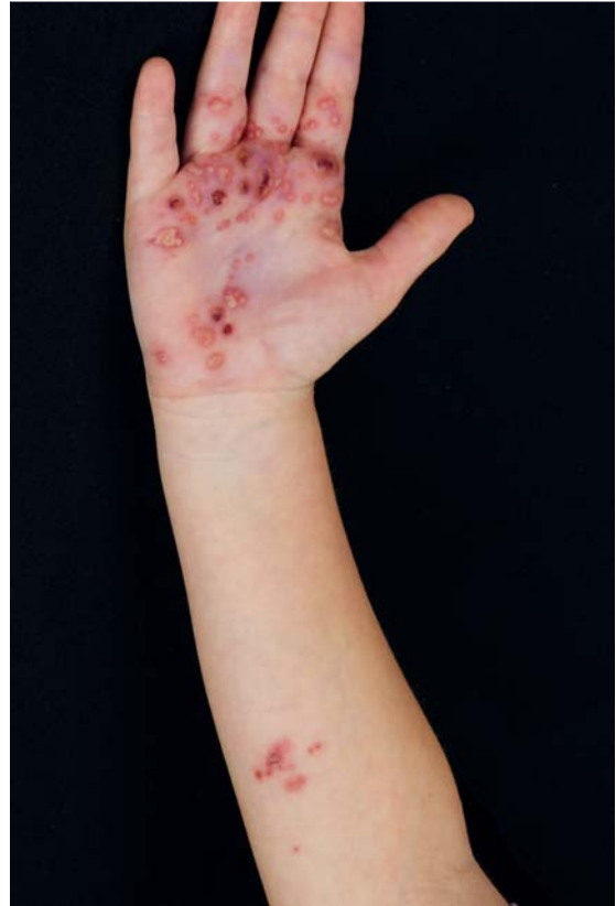
Abb. 12 Herpes zoster. Am rechten Unterarm entlang des C8-Dermatoms, gruppierte Bläschen und Pusteln auf erythematösem Grund.

Cave: Bei schweren Formen, die mit extrakutanen Komplikationen wie Ösophagusstrikturen, Augensynechien, Zahnschmelzdefekten und einer Malnutrition verlaufen, ist eine Anbindung an spezialisierten Sprechstunden, wo eine interdisziplinäre Mitbetreuung der Patienten gewährleistet wird, dringend zu empfehlen.