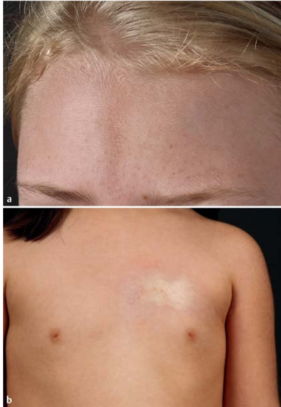
Abb. 16 Morphea. a Lineare Morphea vom En-coup-de-sabre-Typ in der Stirnmitte mit charakteristischer linearer Eindellung. b Morphea vom Plaque-Typ mit zentral glänzender weißlicher Sklerose und umgebendem Erythem („lilac ring“).