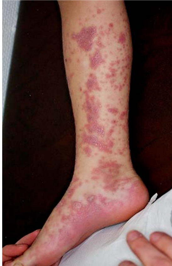
Abb. 14 Lichen ruber. Am rechten Unterschenkel konfluierende livide flache Papeln. Diese sind z. T. durch den isomorphen Reizeffekt (Köbner-Phänomen) striär angeordnet (Cave: Das Köbner-Phänomen wird auch bei der Psoriasis beobachtet).

Der Lichen ruber (Knötchenflechte) ist eine nicht infektiöse, subakut bis chronisch verlaufende, juckende, selbstlimitierende (1 Monat – 10 Jahre) entzündliche Erkrankung der Haut, Schleimhäute und Adnexe (Haare/Nägel) unklarer Ätiologie (Abb. 14). Es werden sowohl eine Autoimmunreaktion als auch virale Antigene (Hepatitis bei Erwachsenen) ätiopathologisch diskutiert. Die Hautveränderungen erscheinen als flache, livide, stark juckende Papeln mit weißlicher Zeichnung an der Oberfläche (Wickham-Zeichnung). Häufig ist eine lineare Anordnung der Effloreszenzen in Kratz- oder Reibespuren als Köbner-Phänomen zu sehen. Die Effloreszenzen sind typischerweise an den Beugeseiten der Handgelenke lokalisiert. In 30 – 40% der Fälle sind die Schleimhäute betroffen. Therapeutisch kommen mittelstarke topische Glukortikoide und Kalzineurininhibitoren zum Einsatz. Differenzialdiagnostisch sind andere lichenoide Dermatosen, z. B. ein lichenoide Arzneimittellexanthem oder lichenoide Graft-versus-Host-Reaktion, in Betracht zu ziehen.