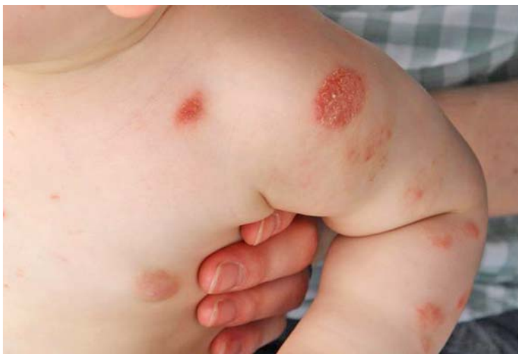
Abb. 7 Nummuläres Ekzem. Disseminiert am Stamm, münzartige, unscharf begrenzte Erytheme mit kleinlamellöser Schuppung.

aus münzenartigen, teilweise „feuchten“ (erosiven), teilweise „trockenen“ (schuppigen) Plaques (Abb. 7). Die Therapie erfolgt mit topischen Steroiden Klasse II, ggf. antimikrobiell und einer intensiven und regelmäßigen Hautpflege. Differenzialdiagnostisch muss man andere Ekzemtypen, eine Psoriasis und eine Tinea corporis abgrenzen.