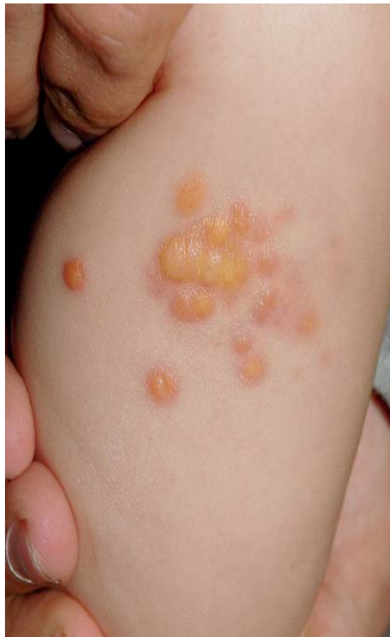
Abb. 15 Xanthogranulom. Mehrere bis 0,5 cm große, derbe, gelbe Papeln, die in eine Plaque konfluieren.