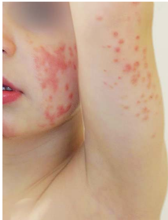
Abb. 3 Gianotti-Crosti Syndrom, auch bekannt als „infantile papulöse Akrodermatitis“. Typisch ist die Verteilung mit symmetrischem Befall der Wangen, der Streckseiten der Extremitäten und gluteal mit monomorphen erythematösen Papeln.

Die Psoriasis ist eine häufige, akut oder chronisch verlaufende Hauterkrankung mit genetischer Disposition . Eine Assoziation mit Übergewicht und metabolischem Syndrom ist mittlerweile auch für das Kindesalter nachgewiesen. Charakteristisch sind streckseitig betonte, scharf begrenzte, rötliche Papeln oder Plaque mit einer silbrigen groblamellären Schuppung (Abb. 4). Es gibt unterschiedliche klinische Formen, die geprägt sind durch: