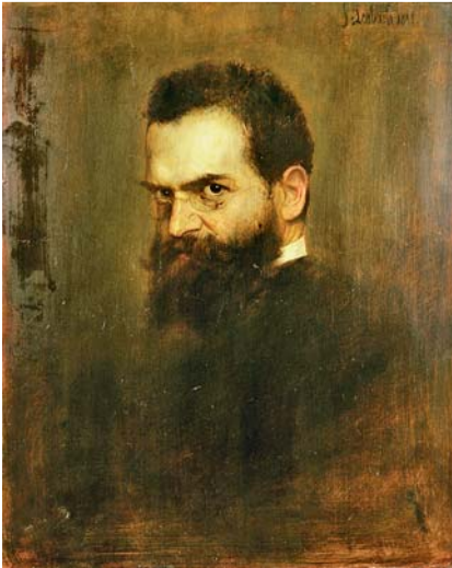
Abb. 1 Ernst Schweningen (1850–1924). Gemälde von Franz von Lenbach, 1888. Standort: Bismarck-Museum Friedrichsruh.