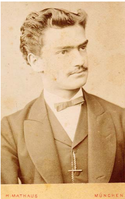
Abb. 2 Ernst Schweningen als junger Arzt um 1873.

te zu diesem Zeitpunkt an der sich abzeichnenden, glänzenden Universitätskarriere des noch jungen Mediziners. Der Privatdozent für pathologische Anatomie hielt ab dem Sommersemester 1876 regelmäßig Vorlesungen und trat in den Jahren 1875 bis 1879 mit 18 Publikationen in Erscheinung [3].