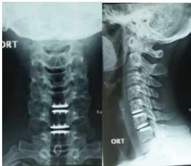
Fig. 3 Artroplastia discal cervical. (A) Radiografia em incidência anteroposterior; (B) Radiografia em perfil.