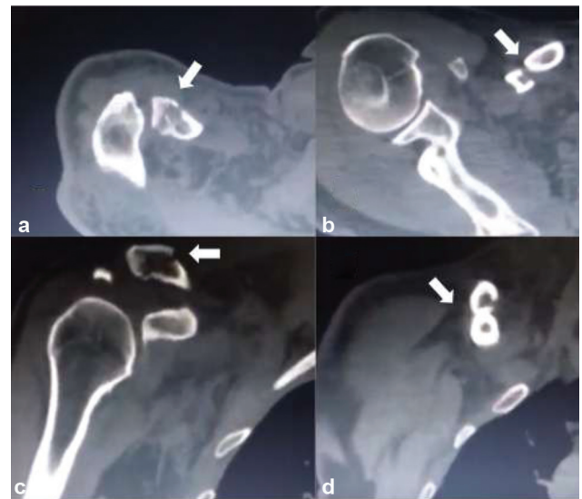
Fig. 2 Tomografia computadorizada de fratura segmentar de tipo 2B2 de Robinson. (a) e (c), Projeções axial e coronal, fratura lateral (seta). (b) e (d) Projeções axial e coronal, fratura medial (seta).

Durante o atendimento, a presença de lesões vasculares e nervosas foi descartada. A fratura da clavícula foi caracterizada com o uso de tomografia computadorizada (TC) (▶ Fig. 2). Após o controle de comorbidades, o paciente foi encaminhado para tratamento cirúrgico. Por meio de incisão superior suficiente e dissecação por planos, a fratura diafisária foi identificada, reduzida e estabilizada com parafuso cortical de tração ( lag ) de 3,5 mm. Em seguida, após a extensão lateral da incisão, a segunda fratura e o acrômio foram expostos, e houve identificação de um pequeno segmento não passível de redução direta. Esse segmento foi submetido à redução indireta com placa de gancho de 3,5 mm. Uma placa de compressão anterior (LCP, na sigla em inglês) de 3,5 mm foi usada para aumentar a estabilidade do construto. Por fim, apesar da utilização de placa de gancho e considerando o padrão de dupla fratura, usamos FiberTape (Arthrex, Naples, FL, EUA) ao redor do processo coracoide para aumentar a estabilidade lateral da articulação acromioclavicular