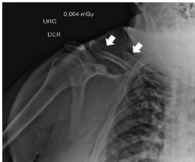
Fig. 1 Fratura segmentar do tipo 2B2 de Robinson da clavícula direita. As setas indicam as duas fraturas.

Um paciente do sexo masculino, de 57 anos, deu entrada no pronto-socorro por politraumatismo em acidente de trânsito.