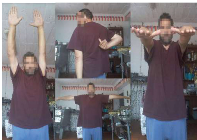
Fig. 4 Resultados clínicos 1 ano após a cirurgia.