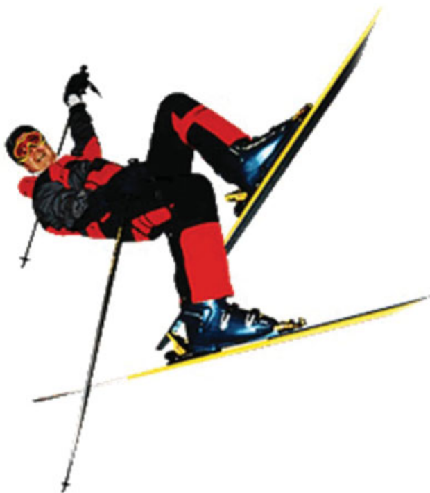
Fig. 1 El esquiador pierde el balance sobre los esquís, y genera una flexión profunda de rodilla, cargando el peso en el canto interno y atrapando el esquí con la nieve, lo que genera una rotación interna de tibia que produce la lesión.

Mecanismo de aterrizaje con peso atrás ( landing back weighted ): similar al inducido por la bota. El esquiador pierde el balance al saltar, aterrizando en las colas de los esquís. Esto genera dos fuerzas, una de traslación tibial anterior, y una de compresión fémoro-tibial (► Figura 3 ).