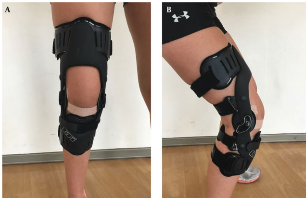
Fig. 7 Paciente esquiador competitivo sometido a reconstrucción del LCA demostrando utilización de órtesis funcional de rodilla.

intervalo de confianza [IC]: 1.2–4.9), así como un aumento en la necesidad de reoperación (RP: 3.9; IC: 1.2–12.3). Los autores concluyen que el no usar órtesis funcionales en pacientes con R-LCA es un factor de riesgo independiente para una nueva lesión, y recomiendan el uso de órtesis en pacientes con R-LCA. Esto se relaciona con una revisión realizada por Negrín y cols. 41 el año 2017, en la cual se evalúa el uso de órtesis profilácticas y funcionales en esquiadores, resultando en una disminución de rerroturas con el uso de órtesis funcionales en pacientes sometidos a R-LCA (→ Figura 7).