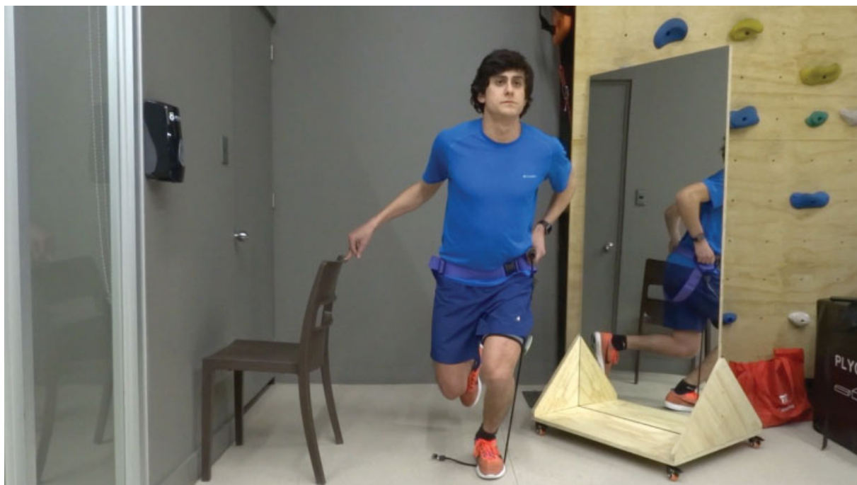
Fig. 6 Paciente realizando pruebas del Vail Sport Test como evaluación para retorno deportivo.

En 2006, un estudio prospectivo realizado por Sterret y col. 40 evaluó el uso de órtesis funcional en trabajadores de un centro de esquí que habían sido sometidos a R-LCA. Se incluyeron 820 rodillas con seguimiento de hasta 6 años, de las cuales un 31% utilizó órtesis. En este estudio, se observó un mayor riesgo de lesión en el grupo sin órtesis (razón de probabilidades [RP]: 2.7;