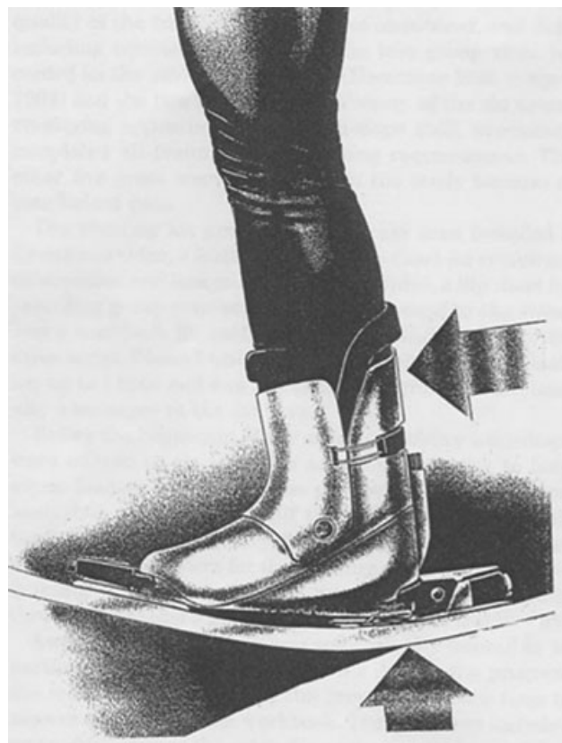
Fig. 2 El esquiador, al perder el balance, lleva su peso hacia atrás, lo que causa una posterior extensión de rodillas. Esto traslada las fuerzas desde la bota, generando una traslación anterior de la tibia que produce la lesión.