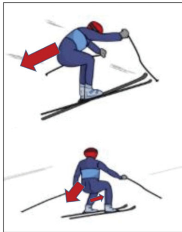
Fig. 3 El esquiador aterriza del salto con un balance hacia atrás. Se genera un brusco cajón anterior y una fuerza de compresión fémoro-tibial que lesiona el ligamento cruzado anterior (LCA).