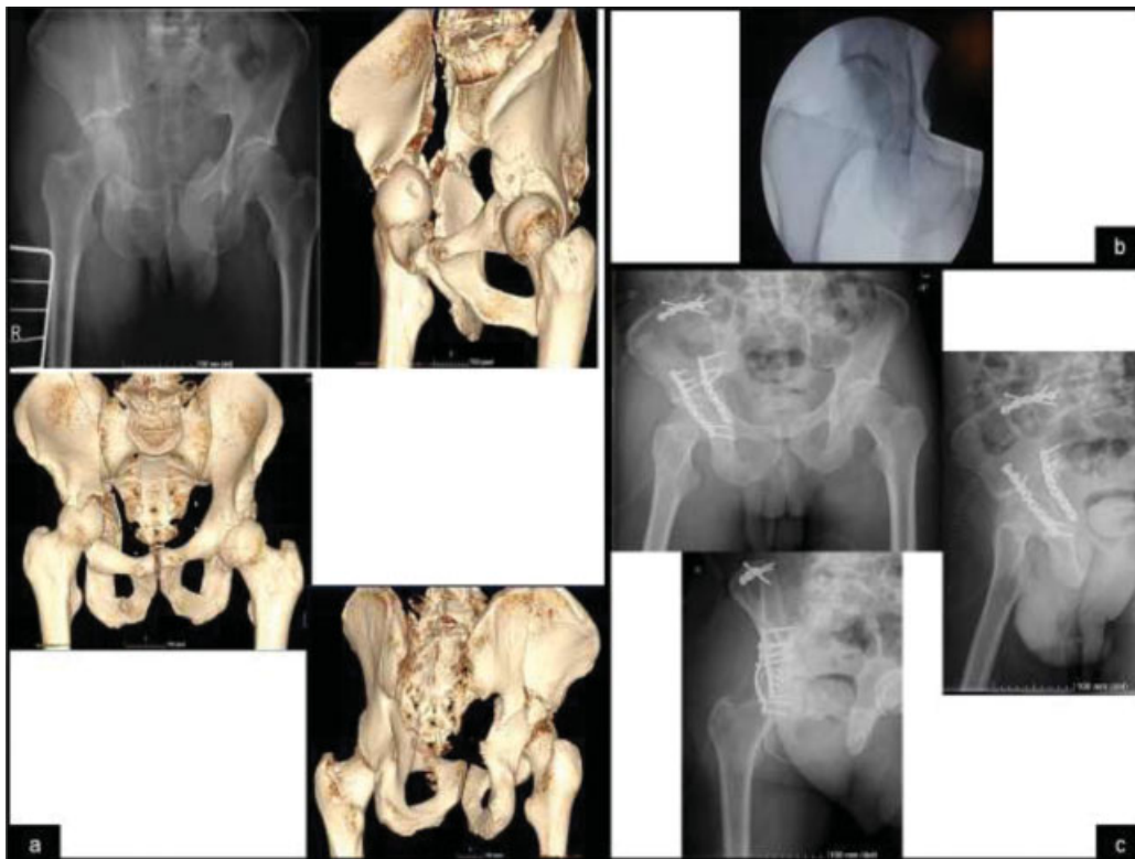
Fig. 2 Imagens de radiografia anteroposterior da bacia e imagens de TAC 3D para melhor caracterização da fratura de duas colunas do acetábulo direito com extensão alta para o ilíaco (a) Imagem intraoperatória após manobras de redução da luxação central (b) Controle radiológico nas incidências anteroposterior da bacia, alar e obturadora da anca direita no pós operatório, com redução aceitável e ausência de parafusos intra-articulares.