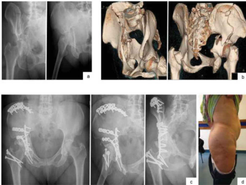
Fig. 1 Imagens de radiografias nas incidências obturadora e alar, com típico sinal do esporão na primeira imagem (a) Reconstruções 3D (b) Controle radiológico nas incidências inlet , alar e obturadora ao 3º ano de pós-operatório(c) Fotografia da paciente com cicatrizes das vias utilizadas (d).