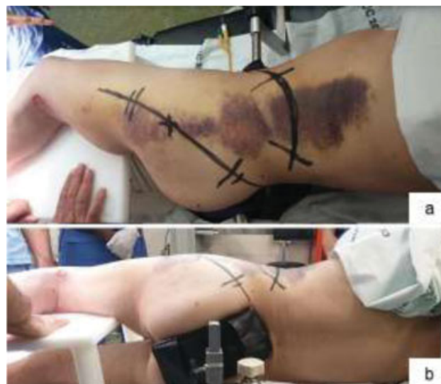
Fig. 4 Posicionamento do paciente em decúbito lateral e marcação prévia das incisões (a) Vista posterior do posicionamento, sendo neste plano que entra o intensificador de imagem (b).

as características da lesão ditaram a opção tomada. A → Figura 4 permite exemplificar o posicionamento e a abordagem, e a → Figura 5 é representativa da sequência sugerida de redução e fixação. Na opinião dos autores, as