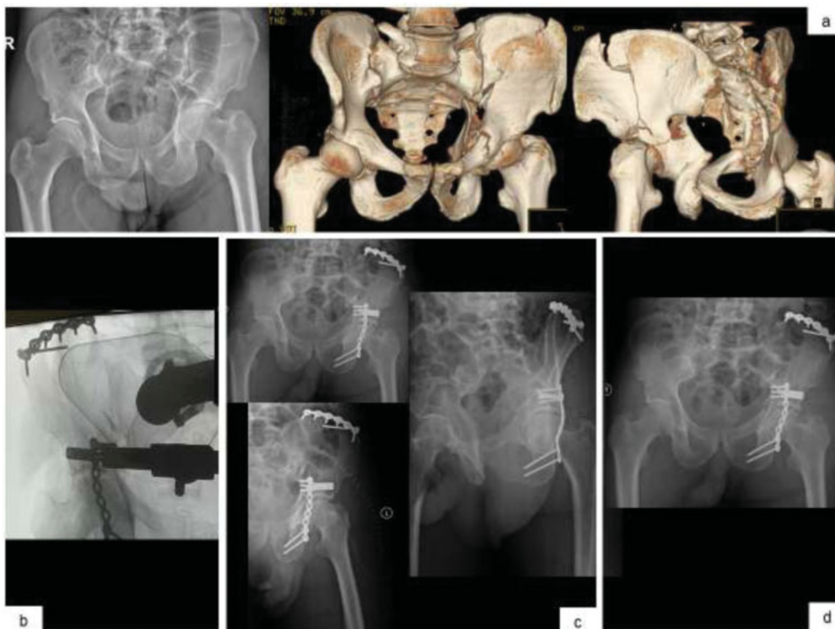
Fig. 3 Imagens de radiografia anteroposterior da bacia e imagens de TAC 3D para melhor caracterização da fratura de duas colunas do acetábulo esquerdo com extensão alta para o íliaco (a) Imagem de controle intraoperatório (b) Controle radiológico nas incidências anteroposterior da bacia, alar e obturadora da anca esquerda no pós-operatório imediato (c) Radiografia anteroposterior da bacia ao 3º mês (d).

Kocher-Langenbeck combinada com abordagem da crista ilíaca. Com 7 meses de evolução, o paciente encontra-se a fazer marcha autônoma e sem dores, com um Harris Hip Score de 91 pontos (→ Fig. 3 ).