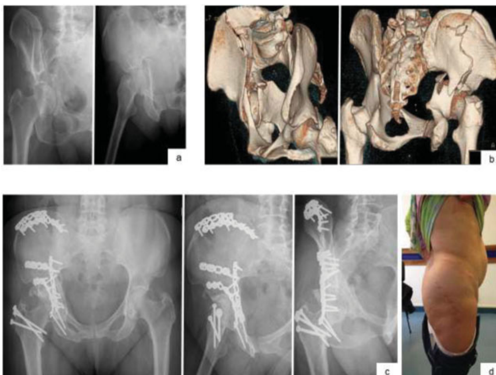
Fig. 1 Imagens de radiografias nas incidências obturadora e alar, com típico sinal do esporão na primeira imagem (a) Reconstruções 3D (b) Controle radiológico nas incidências inlet , alar e obturadora ao 3° ano de pós-operatório(c) Fotografia da paciente com cicatrizes das vias utilizadas (d).