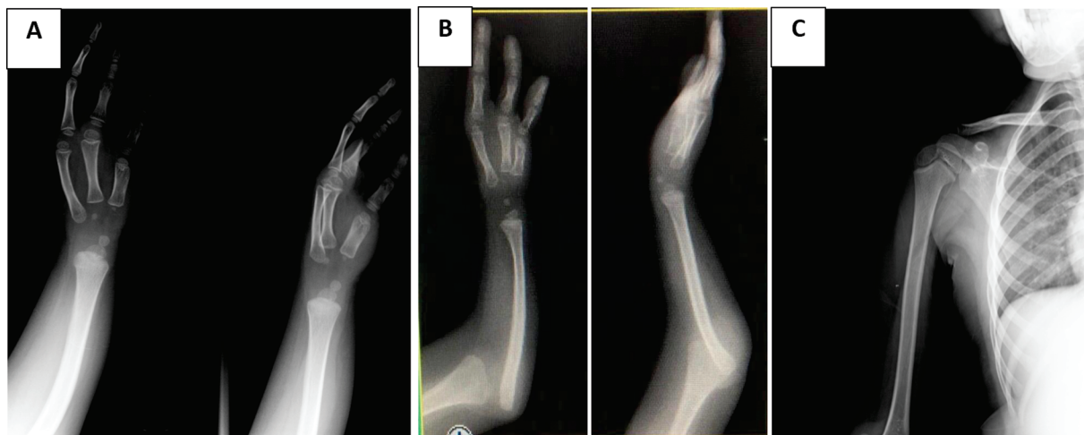
Fig. 2 (A) Mão torta ulnar tipo III de Dobyns, Wood e Bayne – Aplasia total da ulna e ausência de 4° e 5° quirodáctilos direitos e seus respectivos metacarpos com relação articular preservada. (B) Luxação da cabeça do rádio. (C) Ausência de deformidades do úmero proximal.

O resultado da fisioterapia foi mensurado pela escala Goal Attainment Scale (GAS), 7 que elencou três tarefas consensuais entre os familiares e o terapeuta. Os objetivos foram: