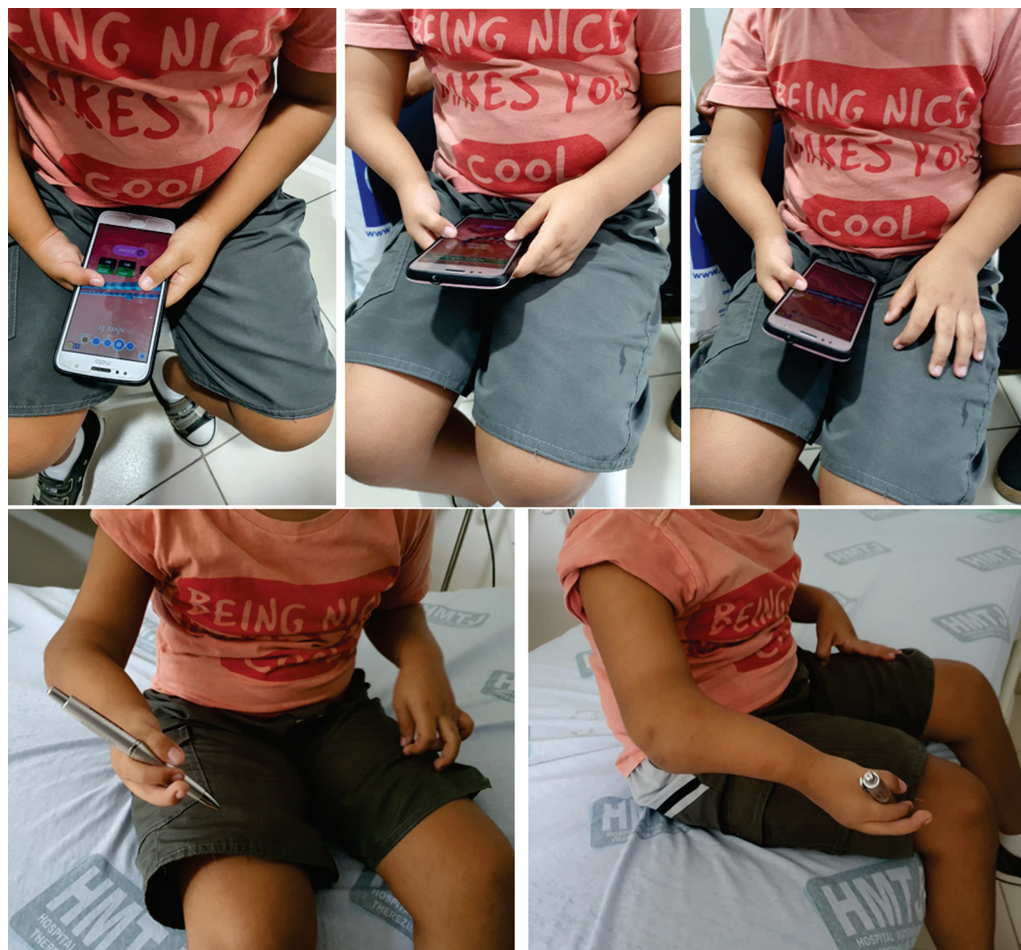
Fig. 3 Imagens ilustrativas da funcionalidade do membro utilizando aparelho eletrônico e demonstrando função de pinça.

para cada objetivo (em uma escala que contém 5 níveis, de -2 a +2). É utilizado para avaliar o desempenho após um período de intervenção especificado. 7