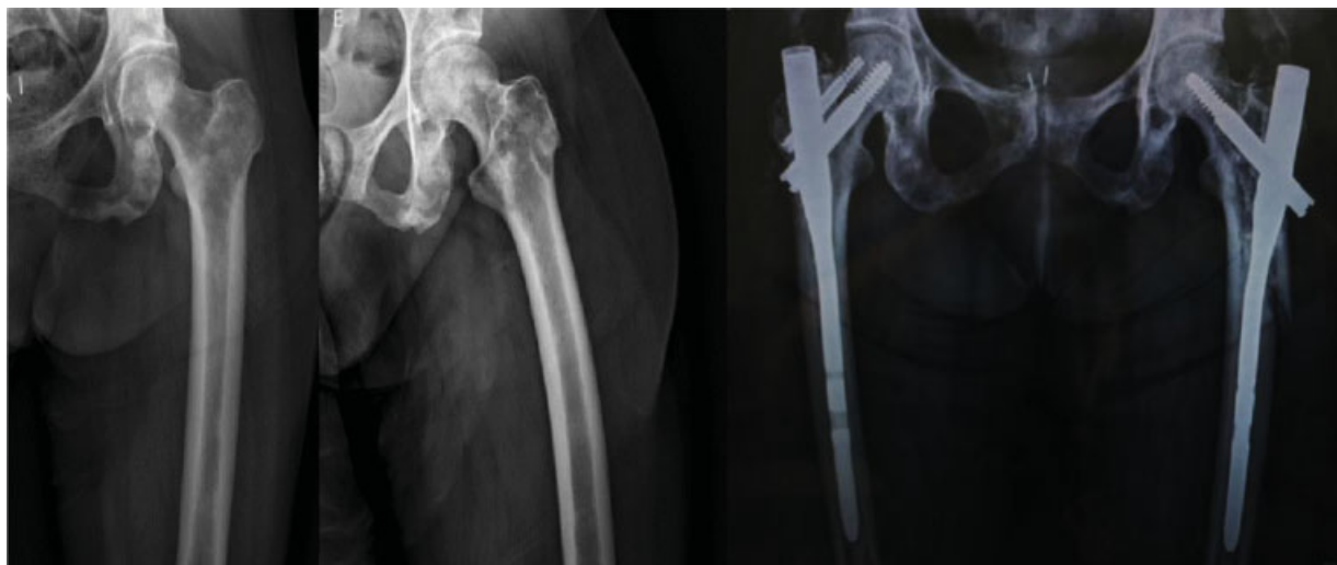
Fig. 2 Lesão metastática de câncer de mama em fêmur proximal em paciente de 61 anos, com fratura transtrocanteriana e iminência de fratura contralateral. Parafuso de bloqueio distal não foi necessário devido à estabilização com cimento.

O objetivo do tratamento nas lesões patológicas é a mobilização precoce, alívio da dor e recuperação funcional o mais rapidamente possível. 18 O escore de Mirels mostrou-se uma ferramenta importante para determinar o momento preciso da fixação profilática em lesões tumorais. 19–21