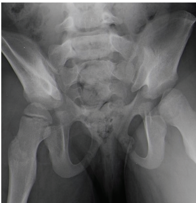
Fig. 2 Radiografia da bacia (outlet).