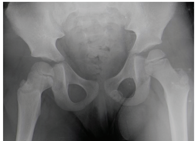
Fig. 1 Radiografia da bacia (incidência ântero-posterior): imagem radiopaca no nível do ramo isquiopúbico esquerdo, de contornos bem-definidos.

Foi realizado um estudo analítico, com hemoleucograma, velocidade de sedimentação (VS) e proteína C-reativa (PCR) sem alterações de relevo. A radiografia da bacia evidenciou imagem radiopaca, com cerca de 1,8 × 1,4 cm, de contornos bem definidos, no nível do ramo isquiopúbico esquerdo (► Figuras 1 e 2 ). Para esclarecimento etiológico, foi realizada