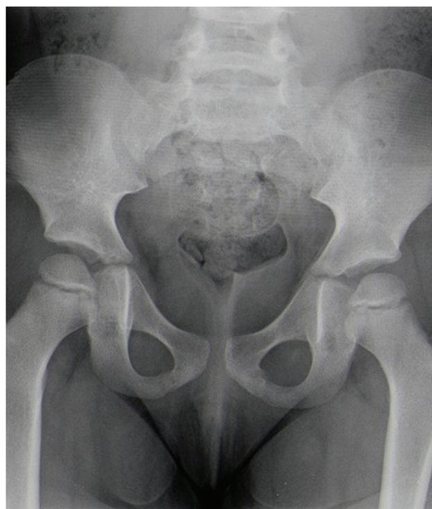
Fig. 4 Radiografia da bacia (incidência ântero-posterior): resolução imagiológica completa.

A claudicação na marcha é uma queixa frequente na população pediátrica, sendo o seu diagnóstico diferencial muito