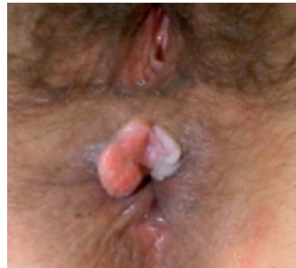
Abb.2 Analrandkarzinom bei einer 47-jährigen Patientin, bei der 10 Jahre zuvor eine Hysterektomie wegen zervikaler intraepithelialer Neoplasie (CIN 3°) durchgeführt wurde.