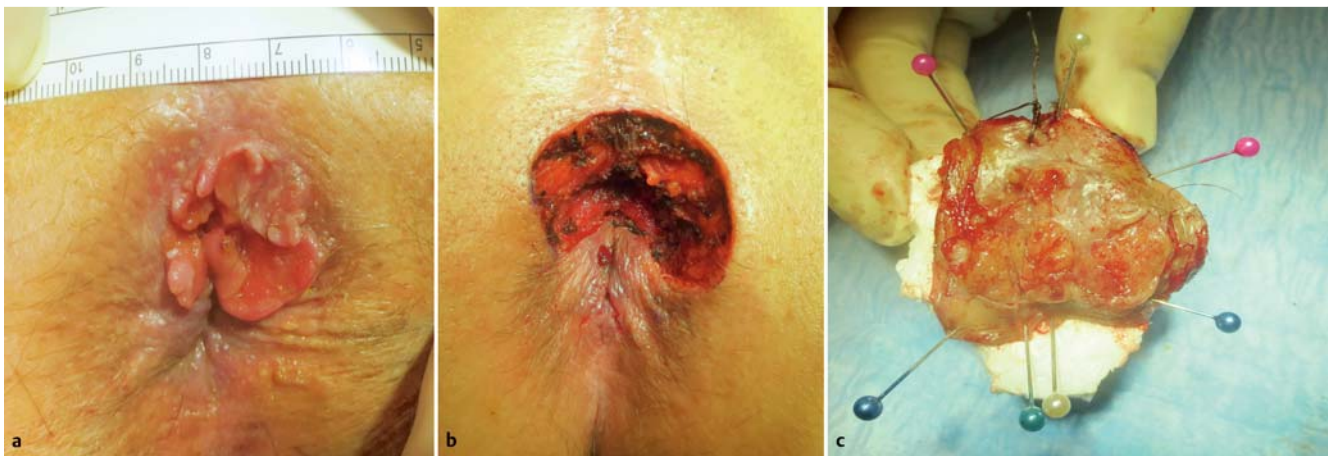
Abb. 5 a Analrandkarzinom pT2. b Analrandkarzinom pT2, Situs nach Exzision. c Analrandkarzinom pT2, Präparat auf Styropor aufgespannt und markiert.