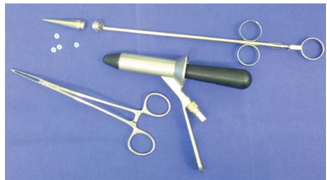
Abb. 5 Instrumentarium zur Gummibandligatur

Die offene Hämorrhoidektomie nach Milligan-Morgan (1937) [16] ist das am weitesten verbreitete Verfahren. Bei dieser Methode werden die Hämorrhoidalknoten segmentär exzidiert und an der Basis umstochen. Die Wunden bleiben offen und heilen sekundär. Es ist dabei wichtig, ausreichend große Anodermbrücken zu erhalten, von denen ausgehend die Epithelisierung der Wunden erfolgt.