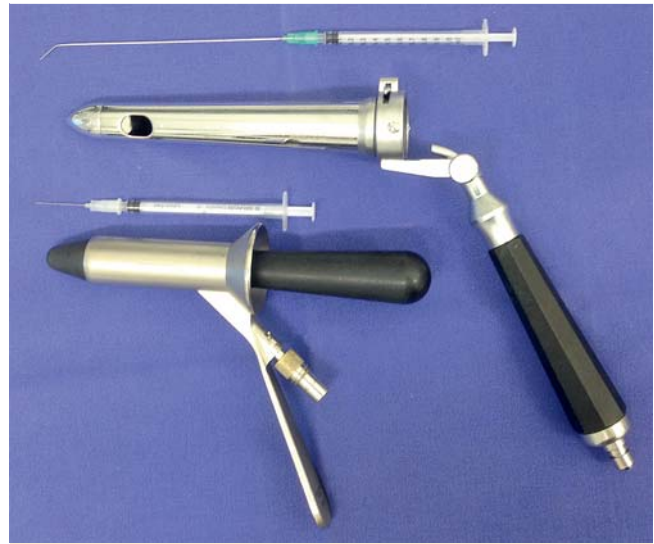
Abb. 4 Instrumentarium zur Sklerosierung.

Weltweit am weitesten verbreitet ist die Technik nach Blanchard [7] oder Bensaude. Hierbei wird das Verödungsmittel proximal der Hämorrhoidalknoten (suprahämorrhoidal) neben das zuführende Gefäß injiziert bei 3, 7 und 11 Uhr im Abstand von 3–4 Wochen, jeweils 3 Depots. Der therapeutische Effekt beruht auf