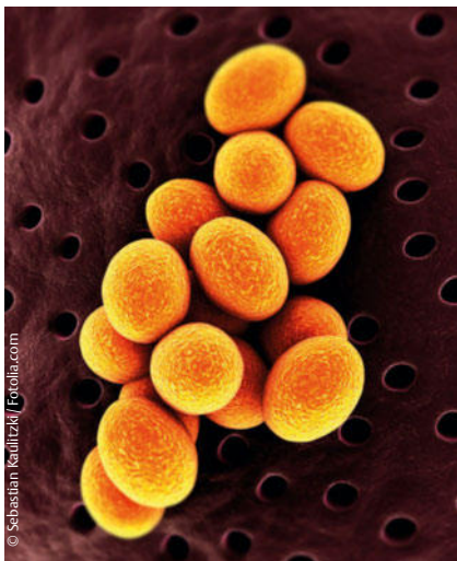
Methicillin-resistenter Staphylococcus aureus (MRSA)

In der randomisierten, doppelblinden Multicenterstudie erhielten 1265 Patienten für 7 Tage entweder Trimethoprim-