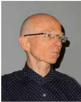
Fig. 5 Torvid Kiserud

Under ISUOG (International Society of Ultrasound in Obstetrics and Gynecology) kongressen i oktober 2015 i Montreal, Canada fikk Torvid Kiserud tildelt Ian Donald Gold Medal. Utmerkelsen er ISUOGs