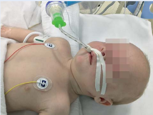
Abb. 11 Nach erfolgreicher Intubation ist eine gute und exakte Fixierung des Endotrachealtubus unerlässlich, da bereits Veränderungen der Tubuslage von weniger als 1 cm, z. B. durch Kopfbewegungen oder Lageveränderungen beim Säugling, zwischen einseitiger Intubation oder versehentlicher Extubation entscheiden können.

Praktische Tipps: Der 2. Helfer kann durch eine vorsichtige externe Manipulation auf Höhe des Schildknorpels (z. B. Rechtsverschiebung des Larynx) möglicherweise eine verbesserte Sicht auf den Larynx erreichen.