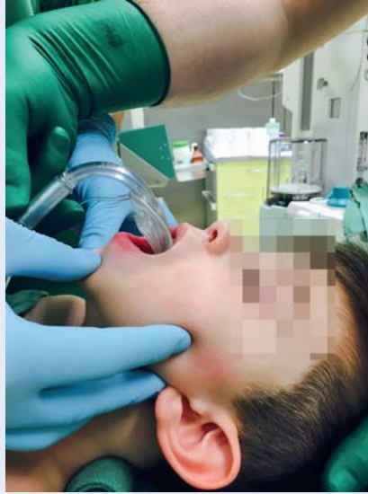
Abb. 7 Die Auswahl der geeigneten LM erfolgt gewichts- bzw. größenabhängig (Tab. 2). Zur Platzierung wird die LM entblockt und entlang des harten Gaumens vorgeschoben. Dafür wird der Kopf des Kindes mittels Nackenrolle und Positionierung in Neutralposition gelagert. Eine Unterkieferprotrusion mit gleichzeitiger Mundöffnung erleichtert die Insertion.

Die meisten Hersteller von SGA bieten mittlerweile Modelle an, die einen Drainagekanal integriert haben. Diese sog. SGA der 2. Generation ermöglichen somit eine zuverlässige Trennung von Gastrointestinal- und Respirationstrakt. Vor allem für die Notfallversorgung erscheint dies sinnvoll, da gastrale Sekrete und Luft nicht nur passiv über den Drainagekanal abfließen können, sondern sich durch die Insertion einer Magensonde auch aktiv evakuieren lassen. Das Konzept der LM zur Verwendung bei Kindern unterscheidet sich nicht zur Verwendung bei Erwachsenen. Weiterführende Informationen zu Anwendung und Funktion von LM der 2. Generation finden sich auch bei [8,9].