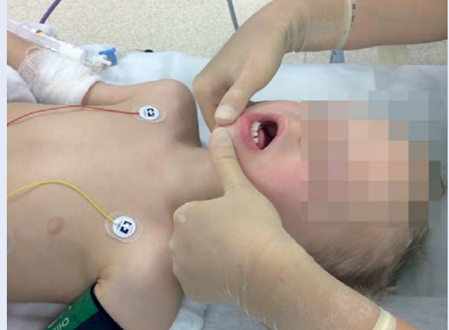
Abb. 4 Bei nicht mehr suffizienter Spontanatmung ist der sofortige Beginn der Beatmung mittels Gesichtsmaske indiziert, um eine Hypoxämie und deren kardi-ale Folgen zu vermeiden. Mittels Protrusion wird nun der Unterkiefer nach vorne gezogen und der Mund gleichzeitig geöffnet. Dabei ist darauf zu achten, dass die Zunge nicht oben am Gaumen anliegt, sondern nach unten fällt und im Unterkiefer zu liegen kommt – dann erst erfolgt das Aufsetzen der Maske. Eine durchsichtige Gesichtsmaske hilft dabei, während der Maskenbeatmung ein kontinuierliches optisches Feedback der korrekten Position zu erhalten.

Cave: Um eine Luftinsufflation in den Magen mit konsekutivem Zwerchfellhochstand, Atelektasenbildung und Verschlechterung der Oxygenierung zu vermeiden, sollte man den Beatmungsspitzenruck möglichst < 15 mbar halten. Bei bereits erfolgter Magenüberblähung sollte der Magen mithilfe einer Magensonde oder eines gastral platzierten Absaugkatheters abgesaugt und entlastet werden [5].