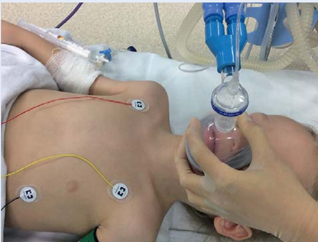
Abb. 5 Die Auswahl der geeigneten Gesichtsmaske erfolgt altersabhängig. Bei Früh- bzw. Neugeborenen eignen sich v. a. runde, durchsichtige Gesichtsmasken aus Silikon, bei Säuglingen auch ovale Masken. Wichtig bei der Auswahl der geeigneten Maske ist, dass diese dicht sitzend Mund- und Nasenöffnung umschließt, ohne über Kinn- und Augenbereich hinauszuragen.

Cave: Um eine Luftinsufflation in den Magen mit konsekutivem Zwerchfellhochstand, Atelektasenbildung und Verschlechterung der Oxygenierung zu vermeiden, sollte man den Beatmungsspitzenruck möglichst < 15 mbar halten. Bei bereits erfolgter Magenüberblähung sollte der Magen mithilfe einer Magensonde oder eines gastral platzierten Absaugkatheters abgesaugt und entlastet werden [5].