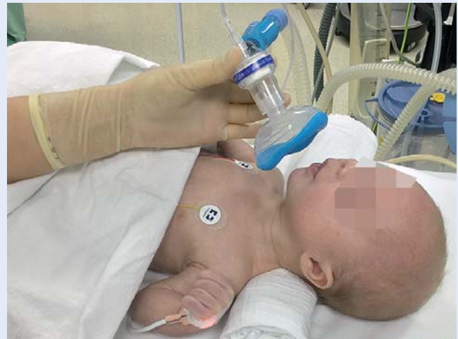
Abb. 2 Um besseren Blickkontakt mit dem Kind halten zu können, kann es günstig sein, die Maske von vorn bzw. neben dem Kind sitzend zu halten. Bei wachen und möglicherweise ängstlichen Kindern bietet es sich auch an, die Kinder auf dem Schoß der Eltern sitzen zu lassen und die Maske zur Sauerstoffapplikation in gegenüberstehender Position zu halten.