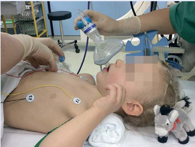
Abb. 1 Bei kleinen Kindern gelingt die Sauerstoffapplikation am besten mit vorgehaltener Sauerstoffmaske bei hohem Frischgasfluss. Bei größeren, kooperativen Kindern können Masken mit Reservoirbeutel die inspiratorische Sauerstoffkonzentration zusätzlich erhöhen.

Praktische Tipps: Bei Atemwegsobstruktion lässt sich durch Anfeuchten der Atemluft häufig eine zügige Besserung der Beschwerden erreichen – ggf. in Kombination mit der Verneblung von Adrenalin (z. B. 1–4 mg Adrenalin inhalativ = 0,25–1 ml Infektokrupp® verdünnt auf 5–10 ml NaCl oder 2,5–5 mg Salbutamol inhalativ verdünnt auf 2–4 ml NaCl).