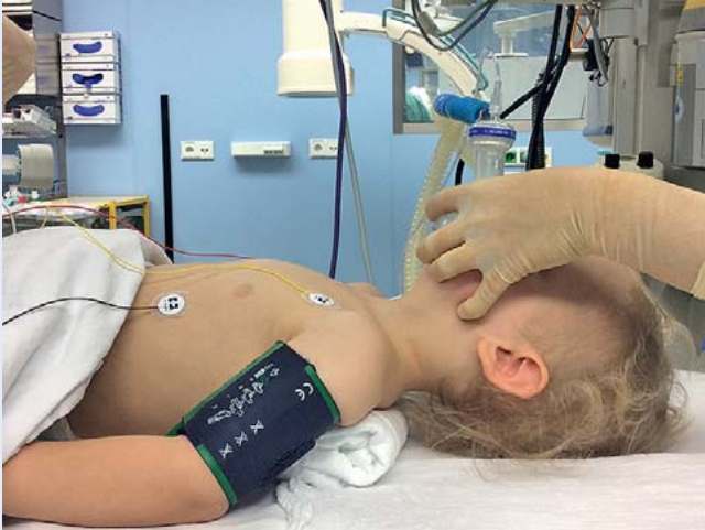
Abb. 3 Für eine erfolgreiche Maskenventilation ist die optimale Lagerung des Kindes obligatorisch. Das Kind sollte mithilfe einer Nackenrolle als Unterlagerung der Schulterregion in Neutralposition (Schnüffelstellung) gebracht werden (Cave: großen Kopf des Kindes beachten), um eine Verlegung des Atemwegs durch Zurückfallen der großen Zunge auf die Rachenhinterwand zu verhindern.