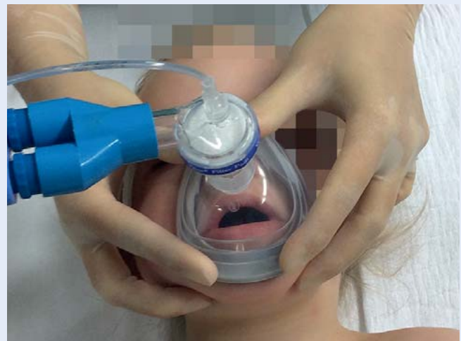
Abb. 6 Beim Erwachsenen häufig eingesetzte Atemwegshilfen für die Erleichterung der Maskenbeatmung, wie Guedel- oder Wendl-Tuben, sind auch in verschiedenen Kindergrößen erhältlich. Diese sollten beim Kind aber erst zur Anwendung kommen, wenn eine Beatmung mittels Gesichtsmaske trotz der oben beschriebenen Lagerungstechniken weiterhin erschwert ist, da jede Manipulation im kindlichen Naso- und Oropharynx neben Schleimhautschwellung und Blutung bei mangelnder Sedierung auch zum Laryngospasmus führen kann [4].

Praktische Tipps: Eine Zwei-Helfer-Methode erleichtert die Maskenbeatmung im Kindesalter, v. a. bei fehlender Routine beim kindlichen Atemwegsmanagement.