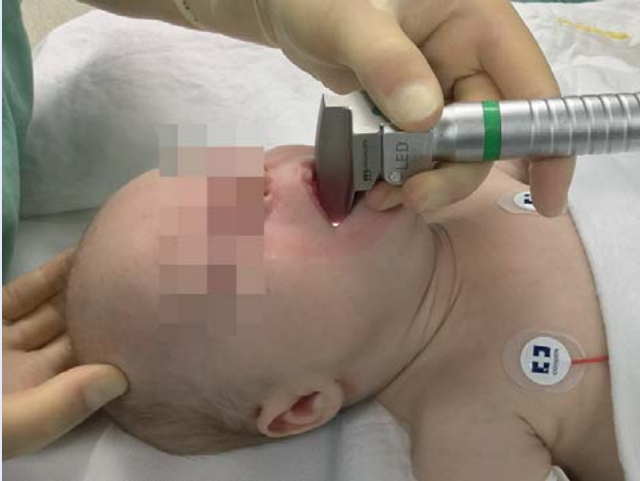
Abb. 9 Die endotracheale Intubation bleibt auch (oder gerade besonders) in Notfallsituationen einem in der Anwendung bei Kindern erfahrenen Mediziner vorbehalten. Die Auswahl des geeigneten Endotrachealtubus erfolgt alters- bzw. gewichtsabhängig (Tab. 2). Hierbei sollten blockbare Tuben mit Low-Pressure-Cuffs und Cuff-Druck-Messung (max. 20 mbar) bevorzugt eingesetzt werden [11]. Spatelgröße und korrekte Tubustiefe sind ebenfalls altersabhängig zu wählen.