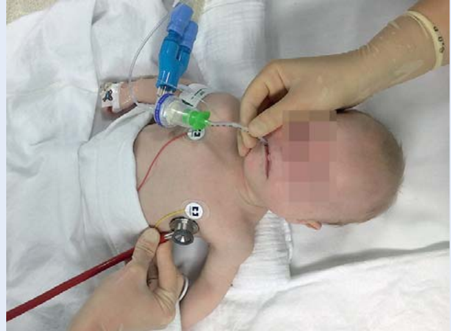
Abb. 10 Eine ausreichende Narkosetiefe ohne erhaltene Spontanatmung und der zusätzliche Einsatz von Muskelrelaxanzien erleichtert die Intubation in der Notfallsituation [4]. Auskultatorische Lagekontrolle und kontinuierliche Kapnografie sind obligatorisch.