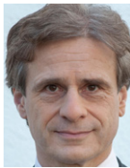
Prof. Dr. med. Dr. rer. nat. Alexander Kekulé

ist Direktor des Instituts für Medizinische Mikrobiologie an der Martin-Luther-Universität Halle-Wittenberg. alexander.kekule@medizin.uni-halle.de