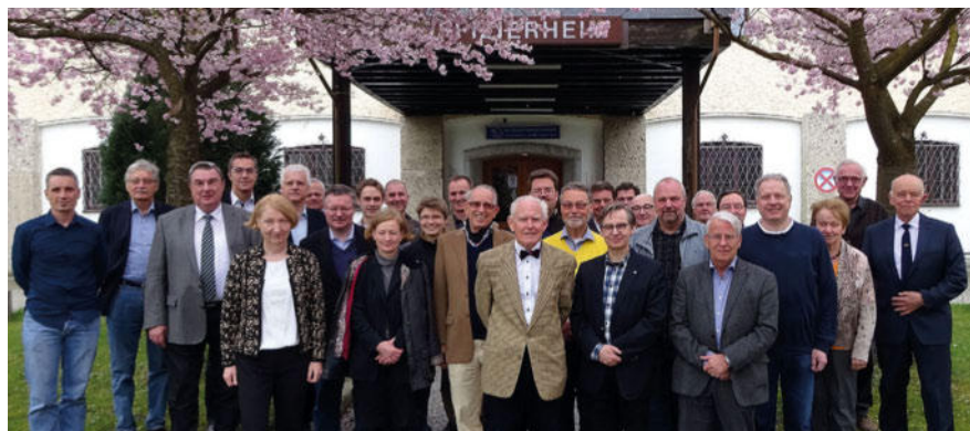
Abb. 1 Teilnehmer der außerordentlichen Mitgliederversammlung am 9. April in Fürstfeldbruck.

Vom 22. bis 28. April 2016 hieß es in Atlantic City, New Jersey „Welcome to the 87 th AsMA annual meeting“. Insgesamt haben mehr als 1500 Teilnehmer aus 57 Nationen daran teilgenommen und ihr Wissen ausgetauscht. Die DGLRM konnte sich in diesem Jahr erneut mit 2 Sitzungen, einer englisch-