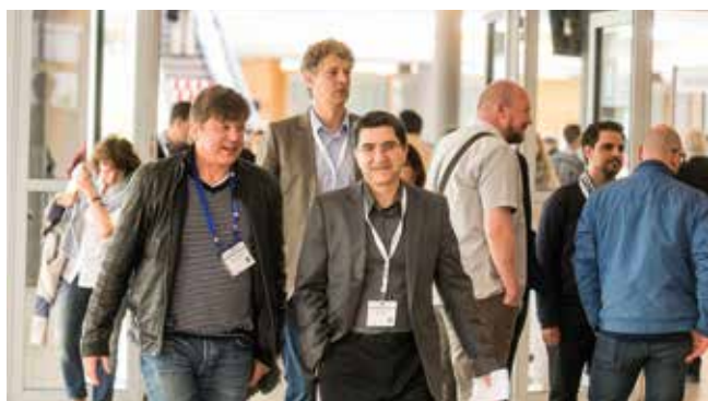
Die Teilnehmer waren von Leipzig begeistert, wie eine Umfrage zeigt