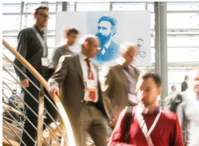
Der 97. Deutsche Röntgenkongress 2016 im Congress Center Leipzig