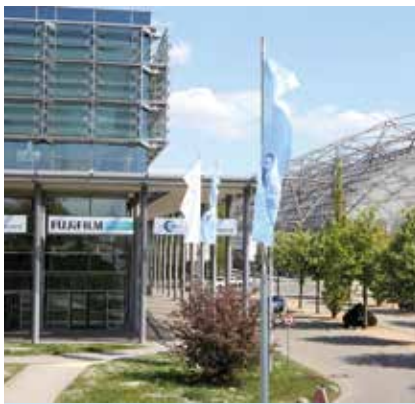
Die neue Heimat des Deutschen Röntgenkongresses, das Congress Center Leipzig

Neben den etablierten Formaten der Wissensvermittlung wie Refresher- und Zertifizierungskursen, Spezialkursen, Symposien und wissenschaftlichen Vorträgen lag ein besonderer Fokus auf interaktiven und praxisnahen Veranstaltungen. Hierzu zählten zahlreiche Workshops, in denen