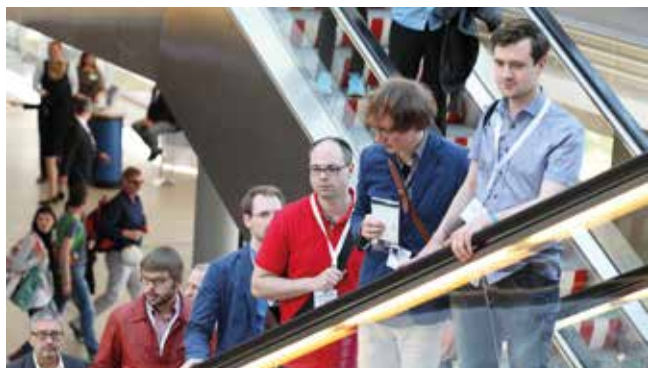
6 800 Teilnehmer fanden ihren Weg nach Leipzig zum 97. RöKo