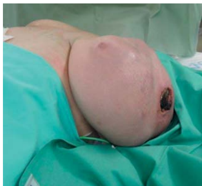
► Abb. 2 Intraoperative Ansicht: kleinkindskopf großer, livide verfärbter, lokal exulzierter Tumor bei 3 Uhr.