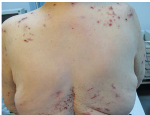
Abb. 2 Sogenanntes „Schmetterlingszeichen“ am Rücken einer Patientin mit chronischem Pruritus bei dialysepflichtiger Niereninsuffizienz.

Typisch ist das „Schmetterlingszeichen“: Am gesamten Rücken finden sich Kratzläsionen - bis auf eine Aussparung in der Mitte zwischen den Schulterblättern (► Abb. 2 ), weil der Betroffene