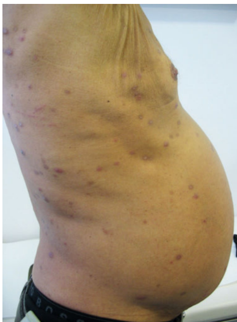
Abb. 3 Hautveränderungen bei cholestatischem Pruritus. Ikterus sowie hyperkeratotische, z. T. exkorierte Knoten im Sinne einer Prurigo nodularis. (Der Bauch ist durch einen mäßigen Aszites leicht vorgewölbt.)

Kratzspuren | Nicht selten setzen Patienten zum Kratzen Gegenstände (z. B. Bürsten und Stifte) ein, die entsprechende Schädigungsmuster bzw. Kratzspuren auf der Haut hinterlassen. Um die Hautbefunde besser einordnen zu können, muss auch das Kratzverhalten der Patienten gezielt erfragt werden. So macht es z. B. einen Unterschied, ob der Patient kratzt, reibt oder die juckenden Stellen anderweitig manipuliert.