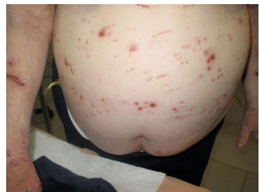
Abb. 4 Typische Hautveränderungen bei urämischem Pruritus. Kratzspuren am Bauch mit Exkorationen.

Einem chronischen Pruritus ohne Hautveränderungen liegt häufig eine der drei folgenden Erkrankungen zugrunde: Eisenmangel, Niereninsuffizienz und Lebererkrankungen.