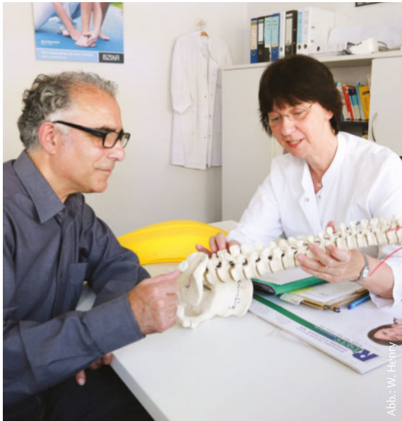
ABB. 4 Gemeinsam mit der Fachärztin für Arbeitsmedizin bespricht der Patient, wie er Entlastungs- und Entspannungsübungen in seinem Arbeitsalltag integrieren kann.