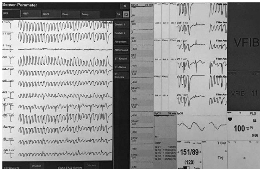
► Abb. 4 Bewegungsartefakte (linke Seite des Bildes) beim wachen Patienten. Nur in Ableitung III ist bei genauer Betrachtung ein PQRS-Komplex zu sehen. Diese Artefakte können etwa dann entstehen, wenn sich ein Rechtshänder die Zähne putzt.

Auch im Operationssaal ist die Situation ähnlich angespannt. Bei 25 herzchirurgischen Operationen ertönten 8975 Alarmer, durchschnittlich alle 1,2 Minuten. Allerdings waren nur 70% dieser Alarmer nach videoassistierter Analyse gerechtfertigt, 30% hingegen Folge von Artefakten. Nur 39% der wahren, gerechtfertigten Alarmer waren indes medizinisch relevant [21]. Auch bei weniger komplexen Operationen ist die Rate an Fehlalarmen vergleichbar hoch [22].