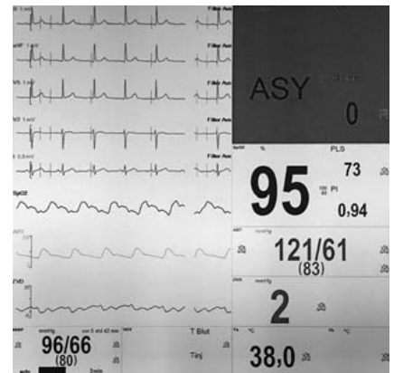
► Abb. 2 Asystoliealarm infolge von Störungen durch motorisch-evozierte Potenziale während einer neurochirurgischen Operation. Trotz vorhandener PQRS-Komplexe, physiologischem invasiv gemessenem Blutdruck und peripherem Puls meldet das Gerät eine Asystolie. Dies ist Folge eines „unintelligenten“ Alarms.

Nicht jeder Alarm bewirkt eine klinische Konsequenz dahingehend, dass ein Mitarbeiter z.B. eine Therapie oder ein medizinisches Gerät anpassen muss. Nach einer älteren Studie ertönten nur 8 von 1455 Alarmen in Folge einer tatsächlich lebensbedrohlichen Situation [20]. Eine neuere Studie aus dem Jahr 2009 zeigt, dass nur 23% aller Alarme auf einer Intensivstation eine Intervention am Patienten notwendig machen [8]. In einer Untersuchung aus