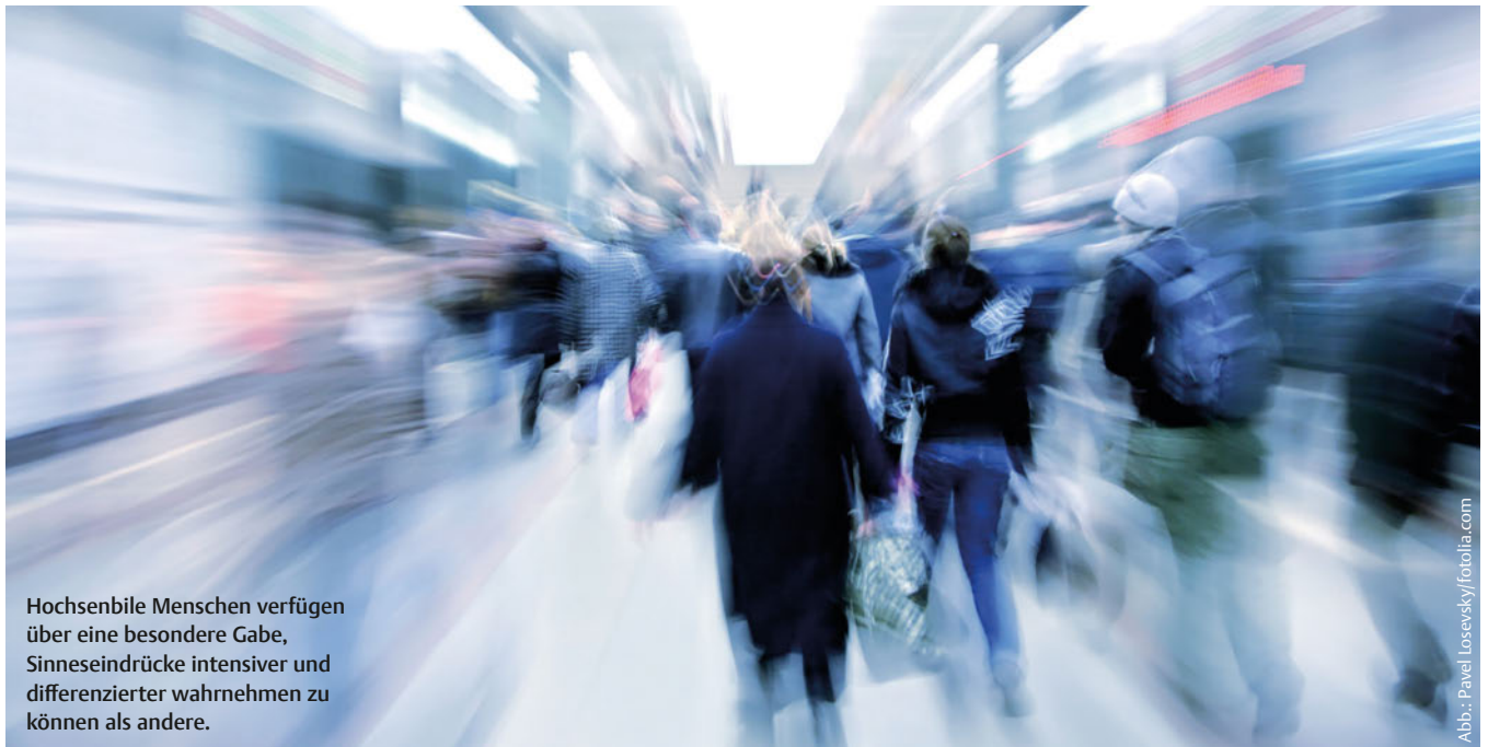
Hochsensible Menschen verfügen über eine besondere Gabe, Sinneseindrücke intensiver und differenzierter wahrnehmen zu können als andere.