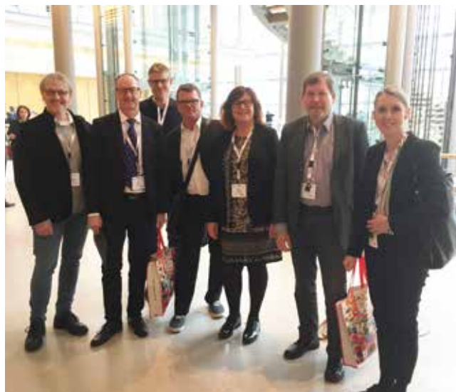
Danske deltagere til EUROSON