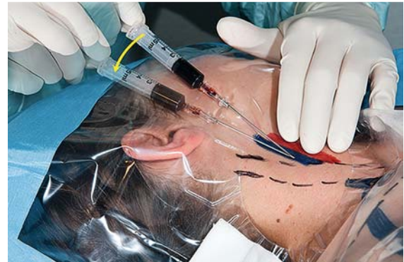
► Abb. 4 Absenkung der Nadel nach erfolgreicher Punktion.

Nach Hautdesinfektion und steriler Abdeckung mit einem Lochtuch erfolgt die Punktion unter Palpation der A. carotis oder unter Ultraschallsicht. Die Stichrichtung sollte in Richtung der ipsilateralen Mamille zielen. Die Punktion erfolgt unter ständiger Aspiration mit einer leichtgängigen Spritze. Im Ultraschallbild kann die Nadel verfolgt werden. Nach erfolgreicher Punktion lässt sich venöses Blut aspirieren. Anschließend wird die Nadel leicht (► Abb. 4 , Pfeil) abgesenkt und mit einer Hand nahe der Punktionsstelle fixiert.