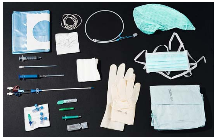
► Abb. 1 Material zur ZVK-Anlage in Punktionstechnik nach Seldinger.

Für die Punktion werden Hautdesinfektion (nicht im Bild) und sterile Handschuhe benötigt. Auf Kittel, Haube und Mundschutz kann im Notfall verzichtet werden. Bei wachen Patienten sollte zusätzlich noch eine Spritze mit Lokalanästhetikum (z. B. mit Prilocain 1%) vorliegen. Folgendes Material muss steril sein: ein Lochtuch, Kompressen, Punktionspritze, Dilatator, Führungsdraht mit Einfädelhilfe, Drei-Wege-Hähne, der ZVK, ein Kabel mit Krokodilklemme, Nahtmaterial (► Abb. 1 ).