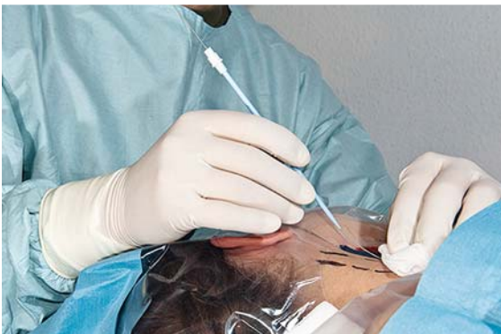
► Abb. 6 Erweitern des Stichkanals.

Mit dem Dilatator wird die Haut an der Einstichstelle vorgeweitet und erleichtert das Einführen des Katheters ins Gefäß. Der Dilatator wird über den Draht vorgeschoben, dabei muss der Führungsdraht weiterhin leicht beweglich bleiben, um der Gefahr einer Via falsa vorzubeugen (► Abb. 6 ). Anschließend zieht man den Dilatator wieder zurück. Eine zusätzliche Stichinzision in die Haut mithilfe eines sterilen Skalpell, v. a. bei großlumigen Kathetern, sollte zuvor erfolgen.