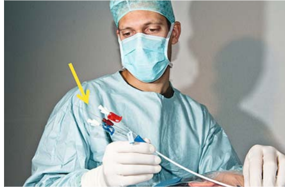
► Abb. 7 Einführen des Katheters.

Der Katheter wird über den Führungsdraht eingefädelt und durch die dilatierte Haut in die Vene vorgeschoben. Bei mehrlumigen Kathetern können vor der Kathetereinführung alle Leitungen durchgespült bzw. entlüftet und müssen durch Klemmen oder Drei-Wege-Hähne verschlossen werden. Der Katheter darf erst die Punktionsstelle passieren, wenn der Führungsdraht durch das distale Lumen ausgetreten ist (Pfeil) und mit einer Hand fixiert wurde (► Abb. 7 ).