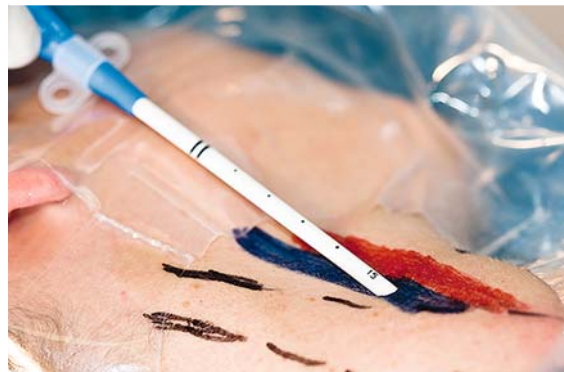
► Abb. 8 Platzieren des Katheters.

Der Katheter wird über den Führungsdraht vorgeschoben. Dabei ist der Führungsdraht zu fixieren, um eine Via falsa und ein zu tiefes bzw. weiteres Vorschieben des Führungsdrahtes zu vermeiden. Während des Vorschubens ist auf EKG-Veränderungen zu achten. Wie tief der Katheter eingeführt werden soll, hängt unter anderem von der Körpergröße, dem Geschlecht und dem Punktionsort ab. Bei der Punktion der V. jugularis interna dextra liegt die Katheterspitze bei Erwachsenen meist bei ca. 15 cm ab Hautniveau (► Abb. 8 ) [5].