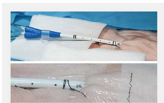
► Abb. 10 Katheterfixierung.

Der Katheter wird mithilfe eines Schlingenverbandes oder einer Naht an der Haut fixiert. Bei der Naht sollte ein Abstand zwischen Haut und Knoten eingehalten werden, um Druckläsionen der Haut zu vermeiden. Die Einstichstelle wird mit einem sterilen Pflaster (wenn möglich) mit Sichtfenster versorgt (► Abb. 10 ).