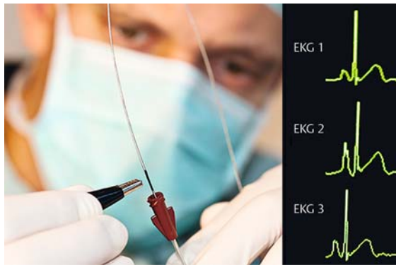
► Abb. 9 Lagekontrolle über EKG-Ableitung.

Wird der Führungsdraht bis zu einer besonderen Markierung zurückgezogen (hier schwarzer Streifen), endet der Draht kurz nach der Katheterspitze. So kann über die Katheterspitze ein intrakardiales EKG abgeleitet werden (rote Elektrode, Ableitung II). Bis zur VCS zeigt sich eine reguläre P-Welle (EKG 1), beim Vorschieben des ZVK in den Vorhof wird die P-Welle erhöht (EKG 2), ggf. biphasisch oder negativ. Anschließend zieht man den ZVK bis zur Normalisierung der P-Welle zurück (EKG 3), sodass er in der VCS direkt an der Einmündung zum Vorhof liegt (► Abb. 9 ). Bei Patienten ohne Sinusrhythmus empfiehlt sich die radiologische Lagekontrolle [3].