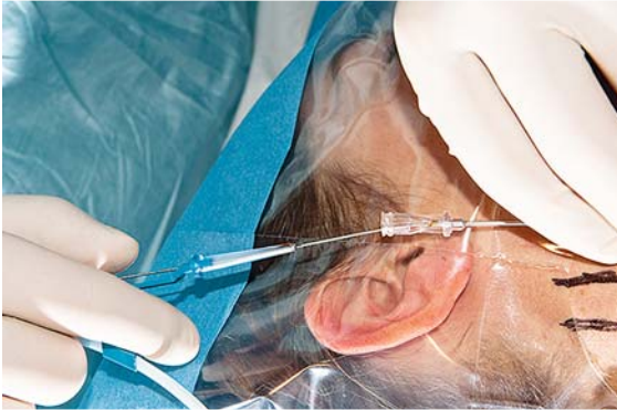
► Abb. 5 Einführen des Führungsdrahts.

Die Spritze wird von der Kanüle vorsichtig abgezogen und die Einführhilfe für den Führungsdraht aufgesetzt. Der Draht sollte sich über die Kanüle mit dem Daumen in kleinen Bewegungen leicht vorschieben lassen. Die Einfädelfilfe sollte dabei unterstützend wirken und mit zunehmendem Vorschieben zurückgezogen werden, bis schließlich nur noch der Draht in der Kanüle steckt. Der Draht wird nun fixiert und die Punktionskanüle vorsichtig entfernt (► Abb. 5 ).