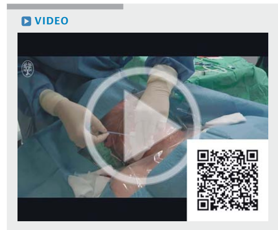
► Video 1 Zentraler Venenkatheter.

Das ► Video 1 zeigt das Vorgehen bei der Anlage eines zentralen Venenkatheters Schritt für Schritt.