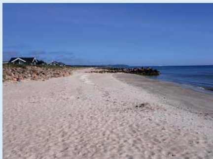
► Fig. 1 Danish beach 2017.

Jeg håber at I alle har haft en god sommerferie. Der har ikke været nogle møder i DUDS i sommerferien og der er derfor ikke mange nyheder. I den kølige sommer med god plads på stranden (► Fig. 1), der har derfor været tid til at se lidt på dansk ultralyd gennem de sidste par dekader. I PubMed findes der 6746 hits, når man søger på ultralyd og dansk affiliation over cirka de sidste 20 år. Søgestrengen der er anvendt er som følger: (((ultrasound OR sonography OR ultrasonography)) AND Denmark[Affiliation])) AND ("1996/01/01"[Date - Publication]: "2016/12/31"[Date - Publication]) NOT 2017 . Det er ikke sikkert at alle artikler er med, men når der foretages en opdeling på de enkelte år, kan man få et indtryk af den tidsmæssige udvikling. På 20 år er der sket næste en fem-dobling af antallet af danske publikationer med 152 i 1996 og 784 i 2016. Udviklingen kan ses på ► Fig. 2. Flere af publikationerne er ikke rent danske, men har måske en eller to danske forfattere. Til gengæld er alle specialer inkluderet og ingen dubletter med kun søgning på PubMed. Der kan være artikler, der ikke er med i opgørelsen, da der ikke er søgt i EMBASE og der kommer heller ikke hit, hvis kun ordret Doppler er med i abstractet, uden ordene ultrasound OR sonography OR ultrasonography. Denne opgørelse er ikke et videnskabeligt arbejde efter et PRISMA flow chart,