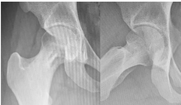
Fig. 4 Radiografia realizada 180 dias após a cirurgia demonstrando formação óssea na lesão anterior.

Foi realizado tratamento endovenoso com anfotericina B por 2 semanas, e a paciente evoluiu com melhora completa da dor articular. Assim, a decisão médica foi de tratamento clínico da osteomielite seguido por fluconazol via oral por 6 meses.