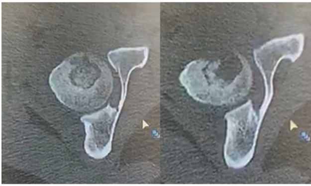
Fig. 3 Imagens axiais iniciais da tomografia computadorizada demonstrando erosão cortical e lesão cavitária.