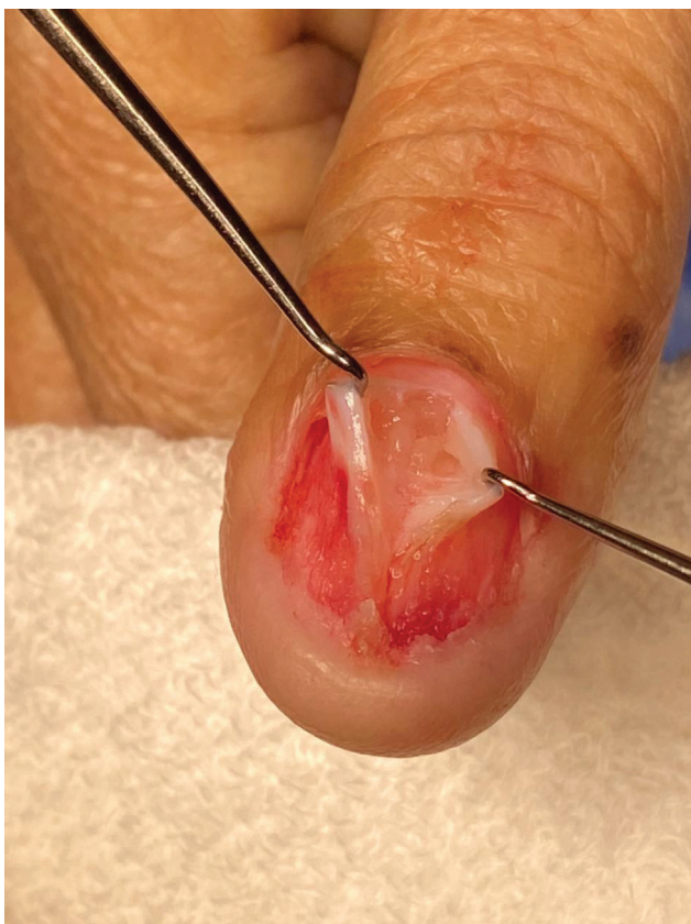
Fig. 1 Tumor glómico subungueal.