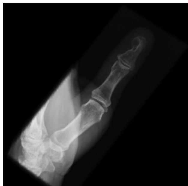
Fig. 4 Radiografía que demuestra compromiso óseo después de la recurrencia de un tumor glómico.