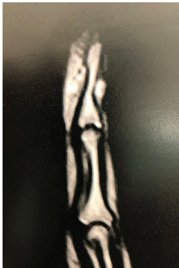
Fig. 3 Tumor glómico subungueal en resonancia magnética del dedo.

En nuestra muestra, más de la mitad (6 de 11) de los pacientes que tuvieron recurrencias también tuvieron un