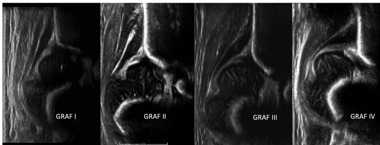
Fig. 2 Nos tipos I e II de Graf os quadris estão centralizados, o tipo D (não representado) é o primeiro estágio da descentralização e os tipos III e IV estão descentralizados.

Hilgenreiner e tem seu valor esperado entre 0,75 e 1,2. O valor normal do IA é apresentado em curvas de normalidade de acordo com a idade e depende da forma de medida, se utiliza como ponto lateral a margem acetabular 35 ou o sourcil . 36 Sendo assim, entendemos que a padronização das medidas é crucial para o acompanhamento clínico.