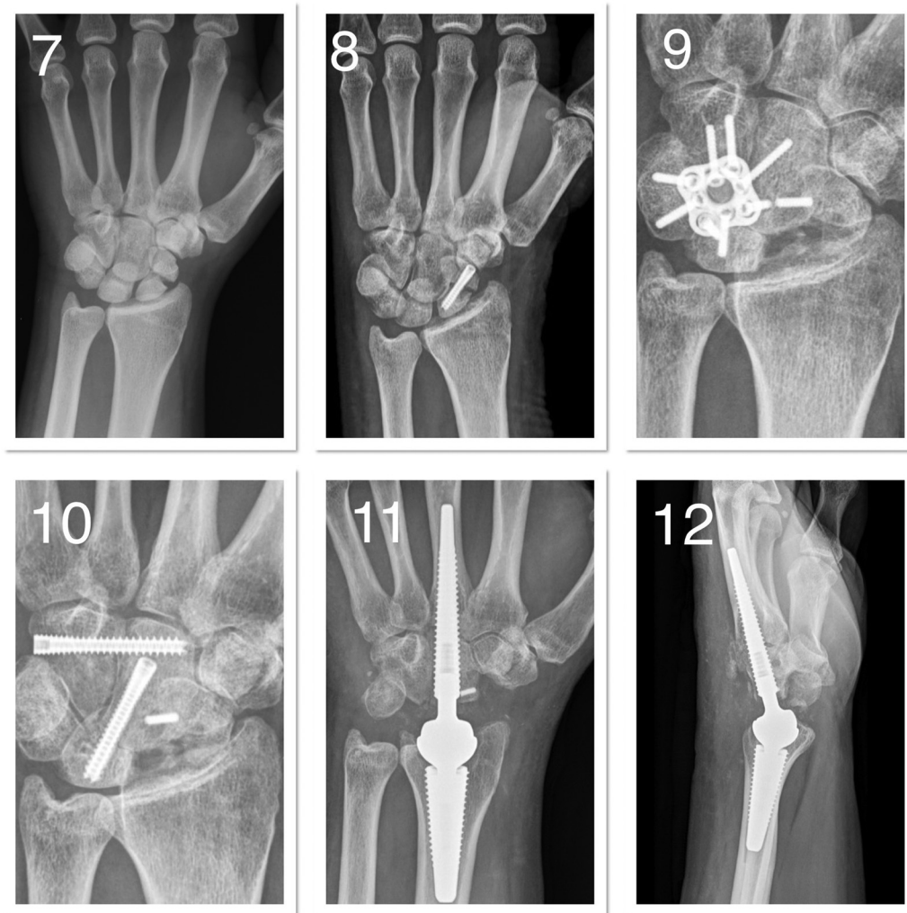
Figura 2 (7) Fractura de escafoides con disociación escafolunar en un paciente de 56 años. (8) intervenido seis semanas después por otro cirujano, y evolución con pseudoartrosis de escafoides y DISI (Dorsal intercalated segment instability). (9) El paciente llega a nuestro servicio después de ser sometido a artrodesis de cuatro esquinas, que evoluciona con fallo de material. (10) Optamos por revisión de la artrodesis con tornillos, pero el paciente seguía presentando dolor después de 12 meses de la última intervención. (11,12) Realizamos la artroplastia de muñeca y el paciente se encuentra asintomático con 1 año de seguimiento.

de cuatro esquinas), y ayuda al paciente a mantener un rango de movimiento funcional. Como se observa en esta serie, las mejoras en términos de función y dolor fueron importantes, no hubo complicaciones mayores en el período evaluado, y la artroplastia de muñeca fue capaz de servir como rescate de las artrodesis parciales fallidas.