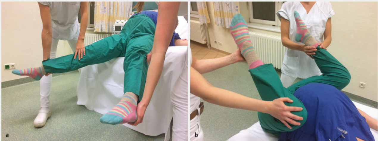
► Abb. 3 McRoberts-Manöver. Im Management der Schulterdystokie sollte nicht fest am Kind/Kopf gezogen werden. Für den Ersthelfer bietet sich das McRoberts-Manöver an. Beide Beine der Patientin werden zunächst gestreckt (a) und anschließend angewinkelt bauchwärts (b) geführt. Dadurch kommt es zu einer leichten Anhebung der Symphysenachse. Das Vorgehen kann mit einem suprasymphysären Druck kombiniert werden. So gelingt es in den meisten Fällen, die Schulter zu lösen und das Kind zu entwickeln.

Im englischen Sprachraum wird das Akronym HELPERR für das Management der Schulterdystokie verwendet (s. Box) [5].