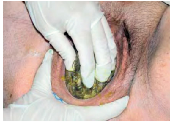
► Abb. 2 Dammsschutz. Die Wertigkeit des Dammsschutzes und der Dammsschutztechniken (Hands on oder Hands off) ist umstritten. Dennoch gehört es zur Hebammenkunst, einen Dammsschutz korrekt durchzuführen. Hierbei gilt es insbesondere, dem Druck des austreibenden kindlichen Kopfes mit der einen Hand entgegenzuwirken. Dabei kann die andere Hand den Damm umgreifen.

In der Eröffnungsphase ist ein zügiger Transport der Patientin in die Klinik vorzugsweise in Linksseitenlage (zur Vermeidung des V.-cava-Kompressionssyndroms) meist problemlos möglich. Gegebenenfalls kann eine Tokolyse (z. B. mit Fenoterol 1 Amp. mit 1 ml = 25 µg in 4 ml Trägerlösung; Injektion von 5 µg langsam i. v., ggf. einmalige