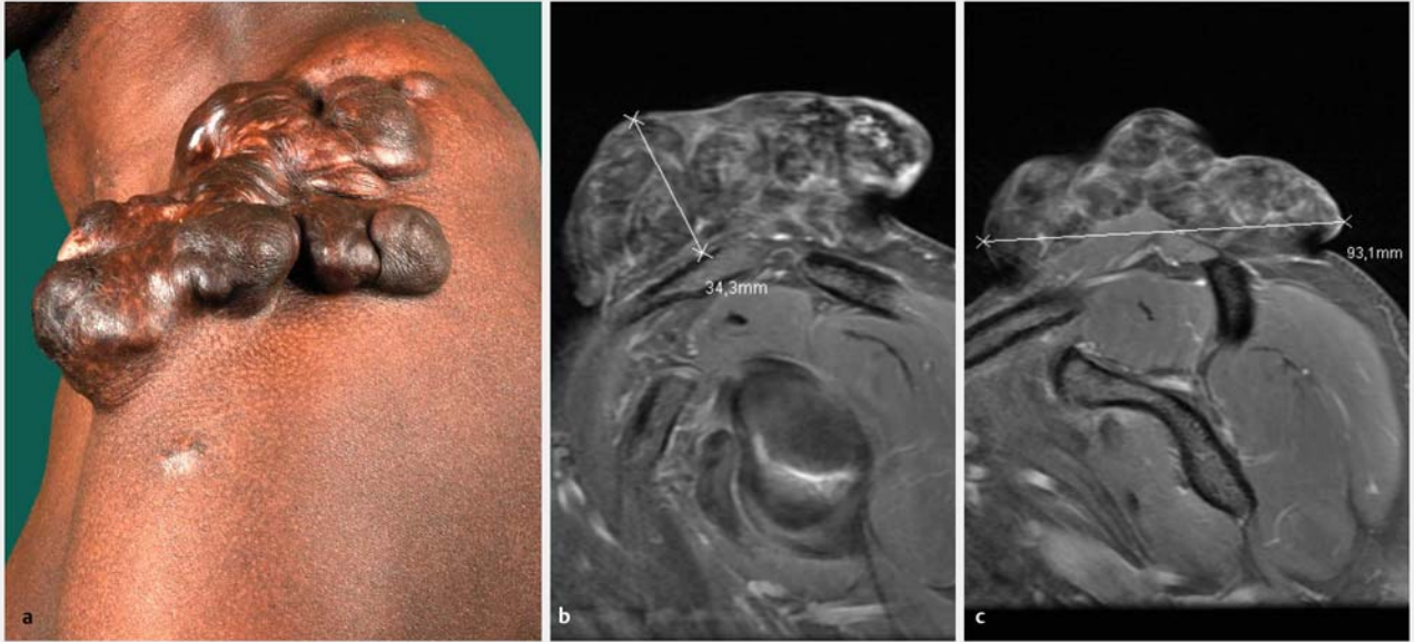
► Abb. 1 a Klinisches Bild des KFT im Dezember 2015; b MRT des KFT vom Mai 2012, 1. Ebene; c MRT des KFT vom Mai 2012, 2. Ebene.