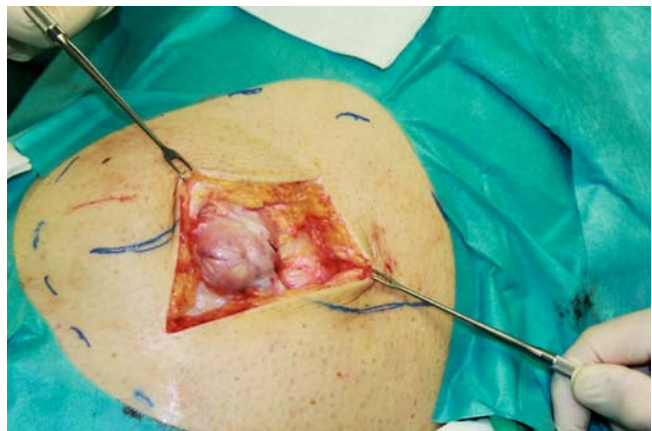
► Abb. 2 Intraoperativ.