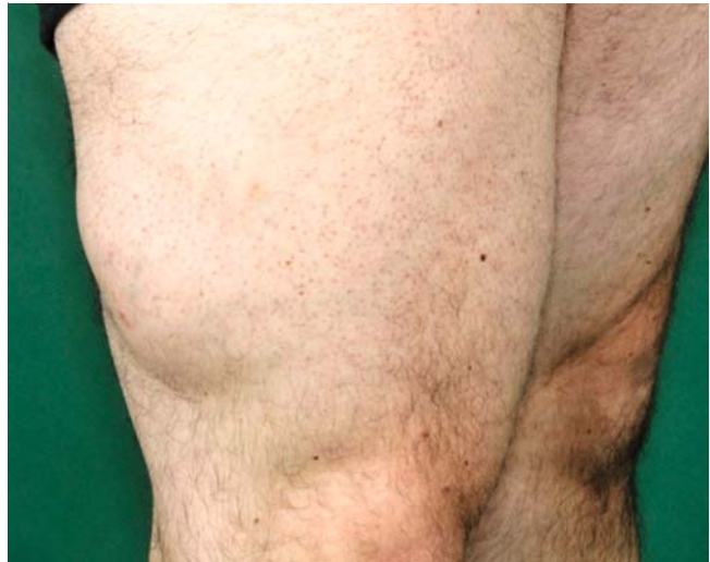
► Abb. 1 Präoperativ.

Bei der Wiedervorstellung nach 3 Monaten konnten in der Verlaufssonografie weitere Knoten proximal des ersten OP-Areals festgestellt werden. Diese wurden einer ergänzenden operativen Entfernung zugeführt. Der Patient befindet sich aktuell in regelmäßiger Tumornachsorge mit klinischen und sonografischen Untersuchungen.