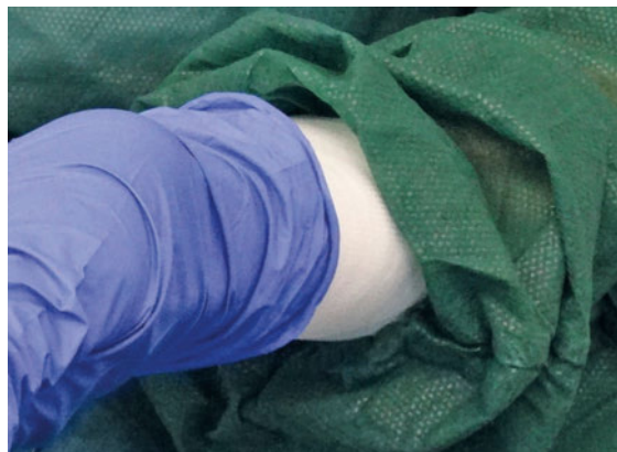
► Abb. 3 Anlegen der Schutzhandschuhe. Der Handschuh wird über das Handgelenk und den Schutzkittelbund gezogen.