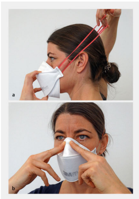
► Abb. 2 Anlegen der Atemschutzmaske. a Befestigen des Gummibandes. b Andrücken des Nasenbügels.