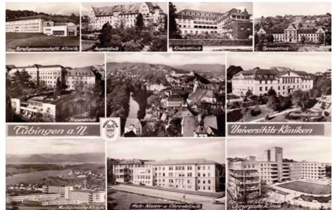
► Abb. 6 Augenklinik oben Mitte links. Mit der berufsgenossenschaftlichen Unfallklinik und der Medizinischen Klinik sind Neubauten hinzugekommen, während alle anderen Kliniken ihr äußerliches Gesicht noch bewahrt haben. Im Zentrum Ansicht des Tübinger Schlossbergs mit Neckar, Stiftskirche und Schloss Hohentübingen. Damit unterstreicht auch diese Postkarte die „Symbiose“ von Kliniken und Stadt. Undatiert, ca. 1965.