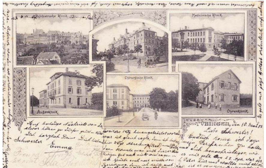
► Abb. 1 Erste Universitäts-Augenklinik Tübingen in der Wilhelmstraße (links unten). Da die Spezialisierung in der Medizin erst 40–50 Jahre zuvor begonnen hatte, gab es seinerzeit in Tübingen nur 6 Fachdisziplinen, die über ein eigenes Gebäude verfügten. Die Augenheilkunde als ältere Disziplin gehörte dazu. Datierung und Poststempel vom Mai 1903.

Die 2. Tübinger Augenklinik wurde auf einer Anhöhe hinter dem Universitätshauptgebäude errichtet und am 1. Januar 1909 mit 110 Betten in Betrieb genommen. Maßgeblicher Planer war Gustav von Schleich (1851–1928) [2–3, 5–7], der das Ordinariat 1895 von Nagel übernommen