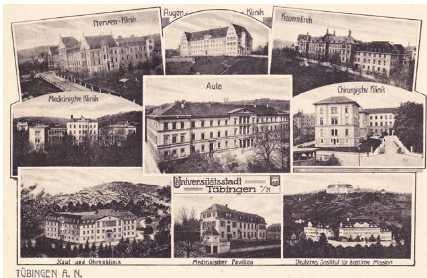
► Abb. 4 Tübinger Kliniken mit neuer Augenklilik oben mittig. Neu hinzugekommen ist die Hautklilik. Im Zentrum der Postkarte die Neue Aula als Sinnbild für die Universität, wodurch die Bedeutung der Kliniken als akademische Einrichtungen unterstrichen wird. Die Karte ist ungeläufig und deshalb ohne Datierung, dürfte aber aus den frühen 20er-Jahren stammen.

hatte und bis 1921 vertrat. Auf allen Ansichtskarten ist diese heute unter Denkmalschutz stehende Augenklilik mit ihrer repräsentativen, der Altstadt zugewandten Südseite fotografiert (► Abb. 2–11 ). Zum Teil erfolgte die Reproduktion wiederum gemeinsam mit anderen Klini-