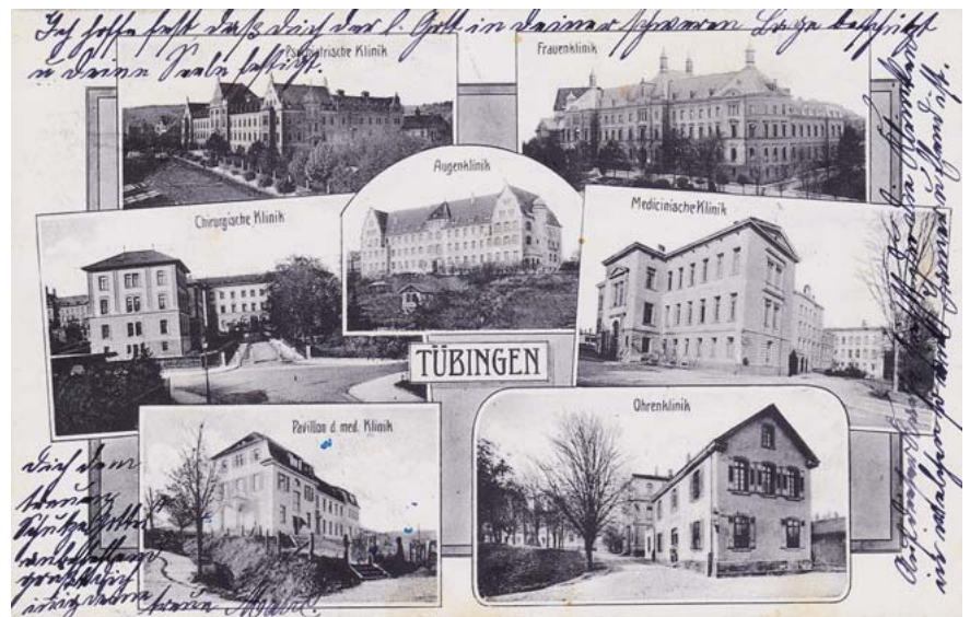
► Abb. 2 Wahrscheinlich, weil die neue 2. Augenklinik erst kurz zuvor in Betrieb genommen worden war, wurde sie im Zentrum dieser Postkarte mit allen Kliniken platziert. Datierung auf den Juli 1912.