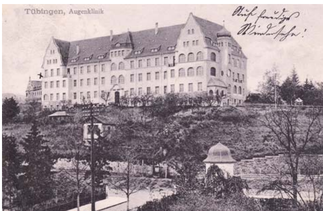
► Abb. 7 Postkarte mit der neuen, 2. Augenklinik als einzigem Gebäude. Der Schreiber berichtete von seinem Aufenthalt in der Klinik. Mit dem Kreuz wurde sehr wahrscheinlich das Krankenzimmer markiert, in dem der Patient lag. Poststempel vom 21. Dezember 1909. Es dürfte sich daher sehr wahrscheinlich um die erste Postkarte der Klinik, die am 1. Januar des gleichen Jahres in Betrieb genommen worden war, handeln.