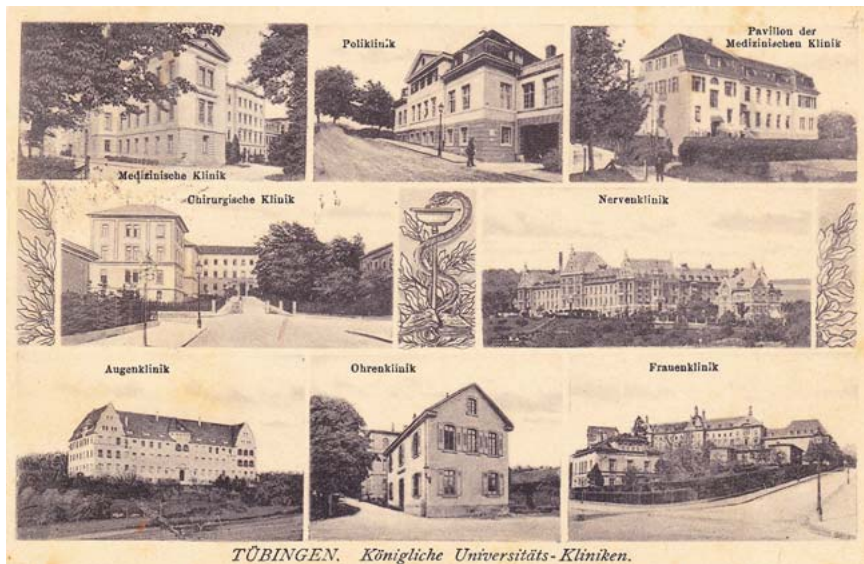
► Abb. 3 Tübinger Kliniken mit Augenklilik links unten. Der im Zentrum befindliche Äskulapstab verdeutlicht, dass die einzelnen Kliniken Teil eines Klinikums sind. Die Zeilen der Schreiberin wurden auf das Jahr 1920 datiert, jedoch stammt die Postkarte wegen des Aufdrucks „Königliche Universitäts-Kliniken“ aus der Zeit vor Ende 1918, denn seit der Abdankung König Wilhelms II. von Württemberg im November 1918 waren die Kliniken nicht mehr „königlich“.