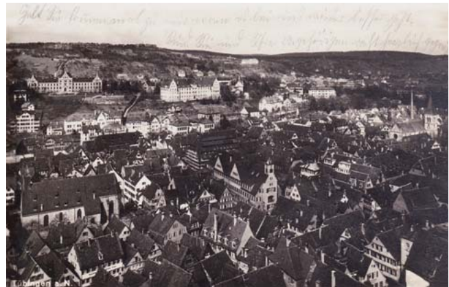
► Abb. 10 Postkarte mit Blick vom Schlossberg auf die Tübinger Altstadt und die Augenklinik leicht oberhalb des Zentrums. Die Augenklinik ist hier „eher zufällig“ auf dem Bild. Man erkennt aber gut, dass sie für das Stadtbild prägend ist. Datierung und Poststempel vom November 1930. Da der Anbau nach Westen noch nicht zu sehen ist, muss die Karte aber aus der Zeit vor 1928 stammen.