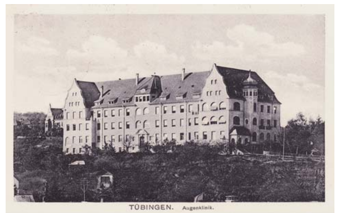
► Abb. 8 Weitgehend identische Perspektive wie in ► Abb. 7 . Datierung und Poststempel vom August 1917. Da der Erste Weltkrieg zu dieser Zeit noch tobte und es sich beim Schreiber um einen Angehörigen oder Patienten des in der Klinik befindlichen Reservelazarets handelte, wurde die Postkarte als „Feldpost“ verschickt.

Ob es der Neubau auf dem Schnarrenberg jemals auf eine Ansichtskarte schaffen wird, bleibt abzuwarten. Das Internet, die heute nur kurze stationäre Verweildauer und der Umstand, dass Krankenhausaufenthalte in der Universitätsstadt Tübingen ganz anders als vor Jahrzehnten heute keine wirklichen, berichtenswerten „Highlights“ im Leben mehr sind, sorgen dafür, dass auf Ansichtskarten verfasste „freundlichste Grüße aus der Augenklinik“ im Wesentlichen nur noch nette, historische Reminiszenzen sind.