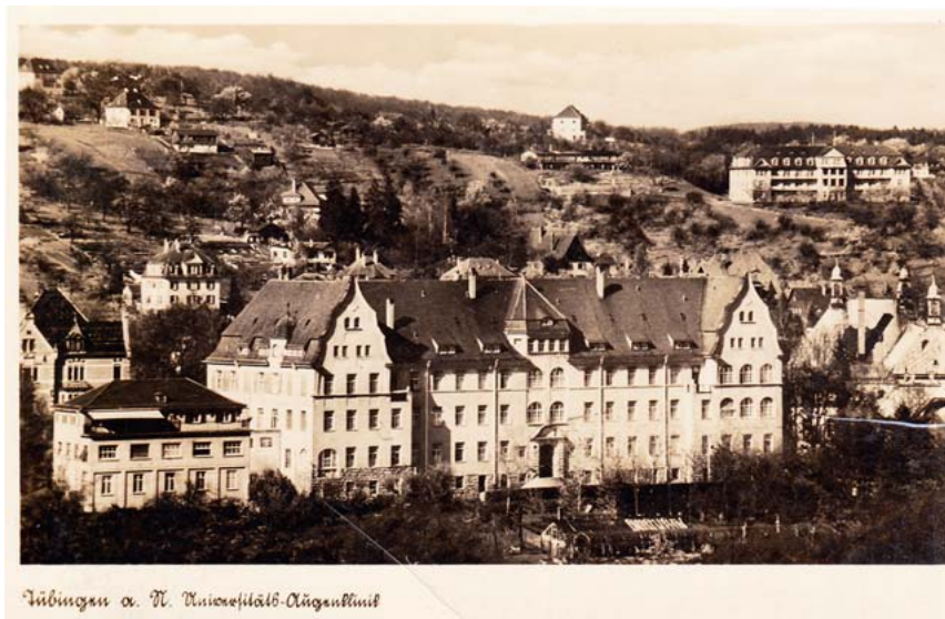
► Abb. 11 Zweite Universitäts-Augenklinik Tübingen, nunmehr mit dem 1927/28 erfolgten Anbau nach Westen. „Tante Klara“ mit Absender „Univers. Augenklinik Saal F“ führte auf der Karte aus: „Muss etwa 3–4 Wochen hier bleiben. Werde tüchtig in Kur genommen. Man kann hier allerhand sehen. Ich habe hier noch viele Leidensgenossen“. In der Tat betrug die stationäre Verweildauer in allen Augenkliniken damals – in der Zeit vor Operationsmikroskop, brauchbarem Nahtmaterial und wirksamen Pharmaka – sehr oft viele Wochen. Datierung auf den Februar 1940.

derband „100 Jahre Augenheilkunde in Tübingen“. Attempto (Zeitschrift der Eberhard-Karls-Universität Tübingen) 1975; 55/56: 50–61