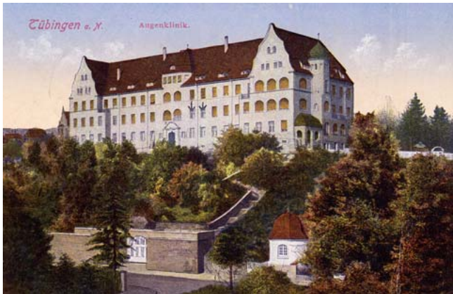
► Abb. 9 Kolorierte Postkarte mit ähnlicher Ansicht wie in ► Abb. 7 und 8 . Poststempel vom 21. Mai 1921.