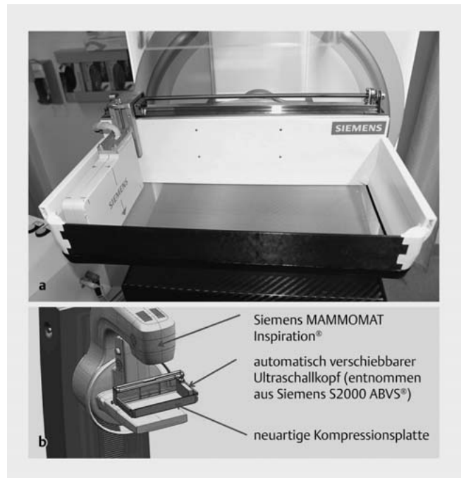
► Abb. 2 a Die Abbildung zeigt den an den Siemens MAMMOMAT Inspiration eingesteckten Prototyp. Der automatisch verschiebbare Ultraschallkopf, entnommen aus einem Siemens S2000 ABVS System, ist auf einer Gewindestange gelagert links im Bild zu sehen und liegt der für die Kompression notwendigen transparenten Gaze auf. b Schematische Darstellung der in das Mammografiegerät integrierten mobilen Schallkopf-Gaze-Einheit.