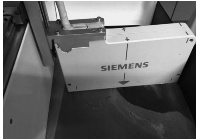
► Abb. 1 Der aus dem ABVS-Ultraschallgerät entnommene Ultraschallkopf fährt über ein mithilfe der Gaze komprimiertes Brustphantom.

Jedes Bildpaar (Aufnahme mit Kompressionsgaze und Aufnahme mit Kompressionsplatte) wurde verblindet und in randomisierter Reihenfolge 2 Radiologen unabhängig voneinander vorgelegt. Es erfolgte eine Beurteilung der Bildqualität mittels Vergleich zwischen den beiden Bildern. Zudem erfolgte eine Auswertung bez. der Detektierbarkeit von Mikrokalk, Makrokalk und Herdbefunden, die teilweise als Korrelat maligner und prämaligener Läsionen gelten [20]. Die Auswertung der Fallserie ist rein deskriptiv auf der