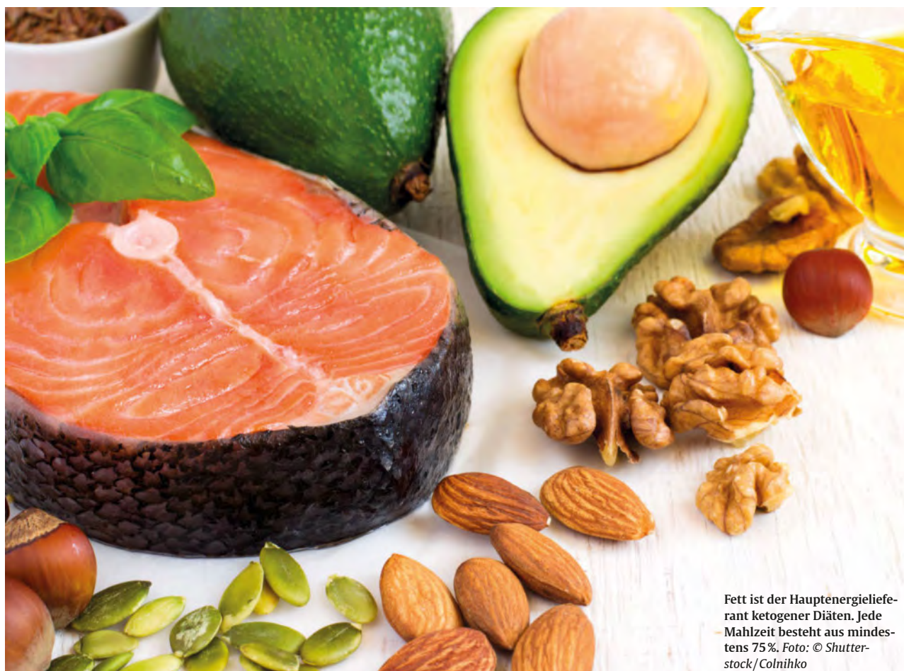
Fett ist der Hauptenergielieferant ketogener Diäten. Jede Mahlzeit besteht aus mindestens 75%.

KDs können bei Krebserkrankungen unterstützend wirken. Der veränderte Stoffwechsel der Patienten ist durch eine gesteigerte Fettoxidation bei gleichzeitiger peripherer Insulinresistenz gekennzeichnet [1] und spricht dadurch gut auf den hohen Fettanteil der Ernährung an. Der reduzierte KH-Anteil hält den Blutzucker und den Wachstumsfaktor Insulin