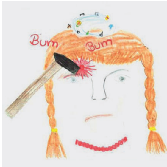
► Abb. 1 „Mein eigener Kopfschmerz“. Zeichnung einer 11-jährigen Patientin mit episodischer Migräne.

Die Physiotherapie hat in der Kopfschmerzdiagnostik und -therapie die Aufgabe, die durch die ärztliche Untersuchung gescreenten Verspannungen und myofaszialen Triggerpunkte der Nacken-, Schulter- und Halsmuskulatur zu bestätigen, zu differenzieren und in Aufklärung, Therapie und Vermittlung von Eigenübungen aufzunehmen.