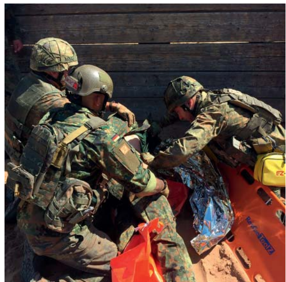
► Abb. 2 Notfallsanitäterazubis auf dem Übungsplatz.

Zum guten Gelingen – auch im internationalen Raum – gehört die Beherrschung der für alle NATO-Mitglieder verständlich und einheitlich festgelegten Sprache „NATO-Englisch“. Deshalb widmet sich ein eigener Kurs in einem Zeitraum von bis zu 3 Monaten dem Business English der Bundeswehr. Er soll auf den Einsatz im Ausland vorbereiten.