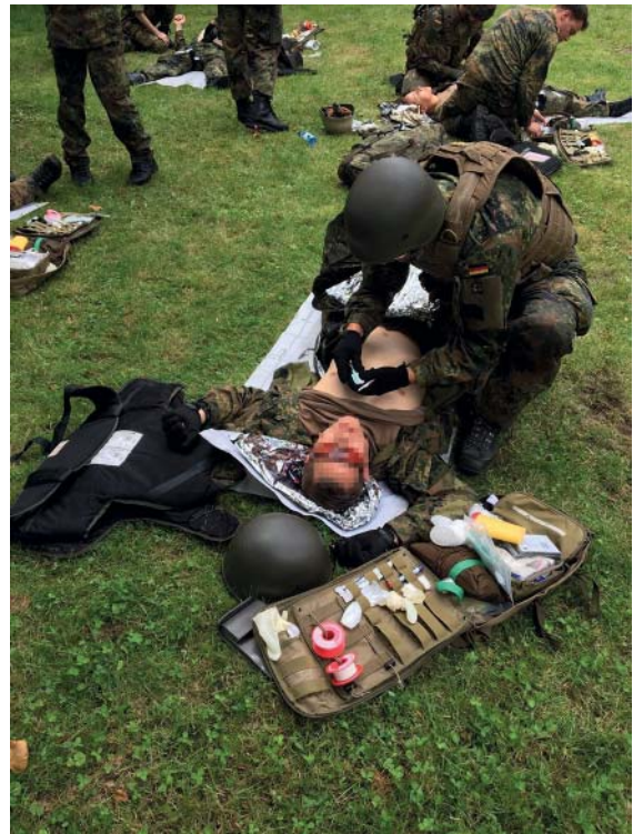
► Abb. 1 Unterrichtung des ABCDE-Schemas.

Im Gegensatz zur zivilen Ausbildung schließen sich auf dem Weg zum „Feldweibel im Sanitätsdienst“ weitere Lehrgänge und Fortbildungen an.