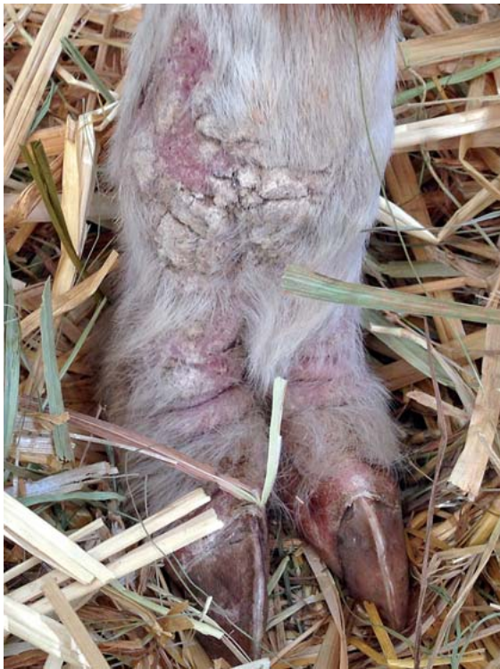
► Abb. 4 Hyperkeratotische Hautveränderung im Zusammenhang mit einer Chorioptesmilbeninfektion im Bereich der distalen Extremitäten.