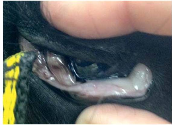
► Abb. 7 Anämische Lidbindehaut eines Alpakas bedingt durch eine akute Cand. Mycoplasma haemolamae Infektion.

Der Übertragungsweg der Haemoplasmen ist bis dato noch nicht vollständig geklärt. Neben der direkten Übertragung von Tier zu Tier über das Blut gelten blutsaugende Insekten als wahrscheinlichste Infektionsquelle. Auch eine vertikale Übertragung des Erregers scheint möglich und wird diskutiert [20]. Die Diagnose erfolgt durch eine Blutuntersuchung (EDTA-Blut) mittels PCR-Technik [19] und eine Therapie ist nur sinnvoll bei akut erkrankten Tieren. Dabei spielt die Durchführung einer Bluttransfusion eine wesentliche Rolle. Die zusätzliche Gabe von Tetracyklinen über einen längeren Zeitraum (20 mg/kg i. m. über mindestens 10 Tage) wird empfohlen. Jedoch ist da-