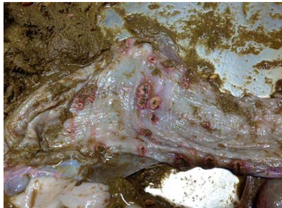
► Abb. 2 Magengeschwüre im Bereich des dritten Magenkompartiments (C3).

Diagnostisch helfen eine exakte Anamnese, die klinische Untersuchung, wenn möglich die Bestimmung des Säure-Basenhaushaltes im Blut sowie die Untersuchung des Mageninhaltes (C1) mittels einer Magenschlundsonde. Da dies für die Tiere jedoch eine immense Stressbelastung darstellt, ist in vielen Fällen die Gewinnung von Mageninhalt nicht möglich. Die Therapie besteht im Ausgleich des Säure-Basenhaushaltes mittels Infusionstherapie, Gabe von Antibiotika und NSAIDs, wenn die Tiere noch selbständig fressen, in einer Anpassung der Fütterung (Raufutter) bzw. symptomatischen Unterstützung der Verdauung, die am besten in der oralen Verabreichung von Panseninhalt besteht.