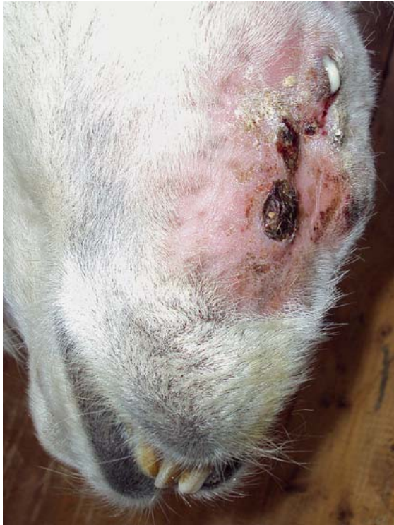
► Abb. 6 Alpaka mit Zahnwurzelabszessen im Bereich des Unterkiefers.

(► Abb. 7 ). In den meisten Fällen führt eine Infektion bei Neuweltkameliden aber zu einem chronischen Trägertum, ohne dass es zum Ausbruch klinischer Symptome kommt [8]. Bei solchen Tieren liegen aber auch Berichte über das Auftreten von Abmagerung, Schwäche oder Fruchtbarkeitsstörungen vor. Diese Trägertiere sind aber dahingehend gefährdet, dass Stresssituationen unterschiedlicher Art, die auf das Tier einwirken, eine akute Erkrankung mit oben beschriebener Symptomatik auslösen können. Zu Stresssituationen zählen, Transport, Teilnahme an Shows, Rangkämpfe in der Herde, Platzmangel, Deckzeitpunkt, Geburt, aber auch das gleichzeitige Bestehen anderer Erkrankungen, wie z. B. einer Endoparasitose.