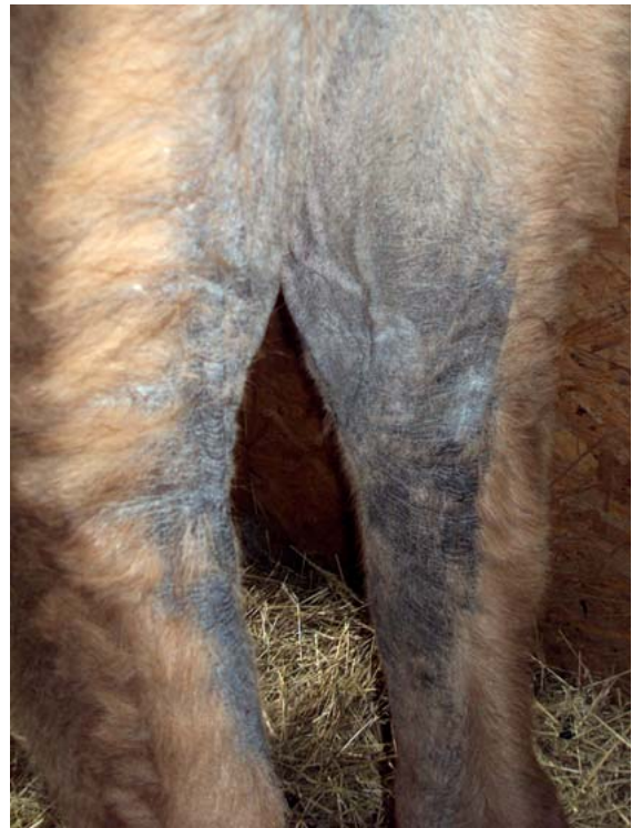
► Abb. 3 Generalisierte Hyperkeratose im Bereich der Hinterextremitäten im Rahmen eines Zinkmangels.

Ein Milbenbefall kann bei Neuweltkameliden (ebenso wie Zinkmangel) das Krankheitsbild der Hyperkeratose ausbilden. Hier steht vor allem der Befall mit Sarcoptes spp. und Chorioptes spp. im Vordergrund. Sarcoptes scabiei