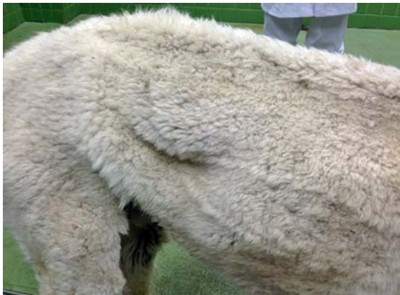
► Abb. 1 Hochgradige Abmagerung eines Alpakas. Der Ernährungszustand wird stets durch Palpation der Bemuskulung im Bereich der Lendenwirbelsäule palpirt. Bei diesem Alpaka ist eine deutliche Abmagerung bereits mit bloßem Auge erkennbar.