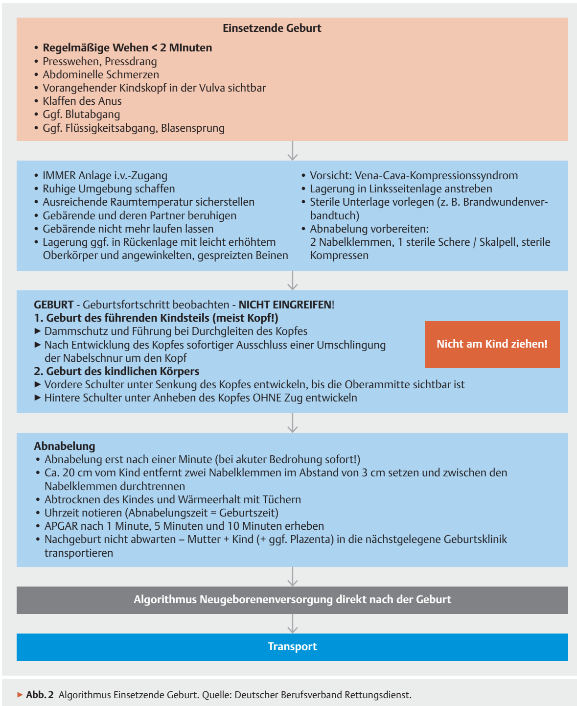
▶ Abb. 2 Algorithmus Einsetzende Geburt.