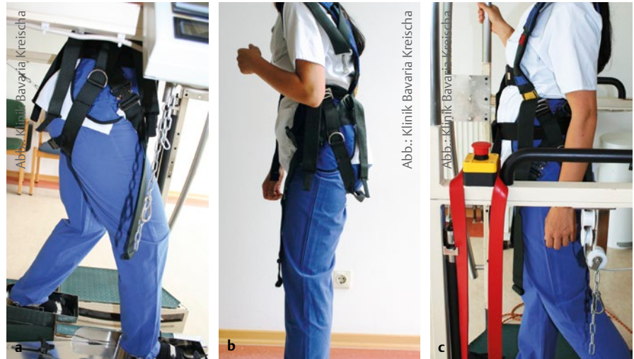
Abb. 2 Roboterassistierte Gangtherapie: Gurtanlage. a Hüftgelenk in der Standbeinphase wird in Extension eingeschränkt. b Oberkörper kann nicht aufgerichtet werden. c So sitzt der Gurt richtig.

Pausen sollten so wenig wie möglich Teil der Therapie sein. Ist es dem Patienten jedoch nicht möglich, 20 Minuten am Stück zu trainieren, können ein bis zwei kurze Unterbrechungen während des Trainings stattfinden. Innerhalb der Pause ist es sinnvoll,