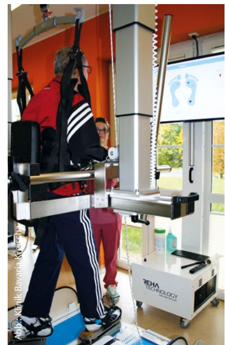
Abb. 5 Externer Fokus während des Gehens. Der Patient achtet auf den Bildschirm.