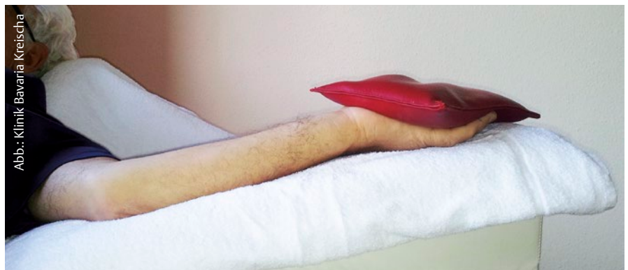
Abb. 7 Dehnlagerung Hand- und Fingerflexoren.

spring®, BI-MANU-Track®), die den Patienten bilateral und unilateral, distal oder proximal betont, selektiv oder komplex sowie passiv oder assistiv unterstützen.