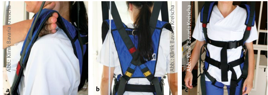
Abb. 3 Roboterassistierte Gangtherapie: Anlage der Schulterriemen. a Vier Finger passen unter den Gurt. b Schultergurt steht zu weit von der Schulter ab. c Oberarm fängt Gewicht des Oberkörpers ab.