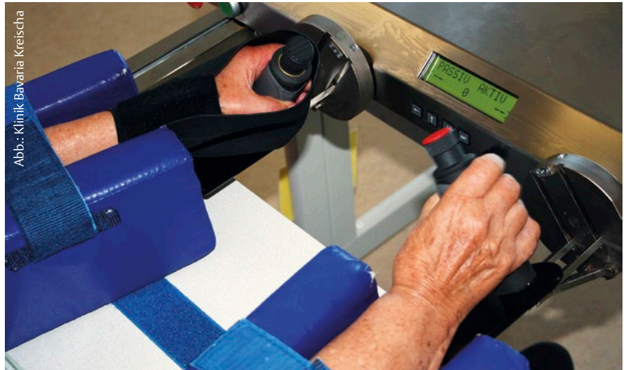
Abb. 6 Der Monitor zeigt die Anzahl der Bewegungen an.

Die Motivation der Patienten ist aufgrund des ausbleibenden schnellen Therapieerfolges oft gering, und die Therapieideen sind begrenzt. Hier bietet die Technologie Hilfe. Es gibt diverse Geräte (z. B. ARMin®, InMotion ARM®, WRIST® und HAND®, ARMEO-