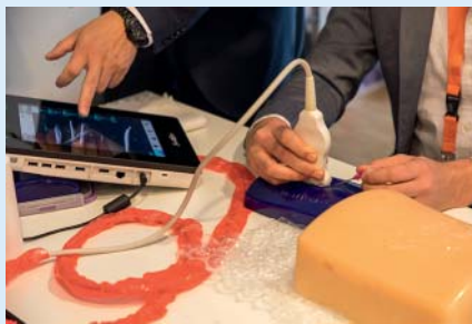
Zahlreiche Firmen präsentierten in den Hands-on-Workshops ihre technischen Neuerungen in Sachen Interventionen.

Der RadiologieKongressRuhr ist schon immer ein Kongress, der seinen Fokus auf die Fortbildung legt. Hier geht es um die Inhalte, Fertigkeiten und Techniken, die Radiologen in ihrer Praxis oder in ihrer Klinik Tag für Tag anwenden müssen. So hatten und haben die Vorträge in den Hauptsessi-