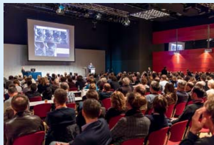
Alle Säle des RuhrCongresses waren stets gut besucht.