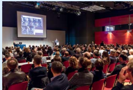
Alle Säle des RuhrCongresses waren stets gut besucht.