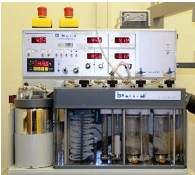
▶ Abb. 1 verwendetes Olfaktometer (OM 2/S Olfaktometer, BURG-HART Messtechnik GmbH, Wedel, Deutschland).

Das Becks-Depressions-Inventar ist ein Selbstbeurteilungsverfahren zur Erfassung der Schwere einer depressiven Symptomatik [16, 17]. Bei dem Fragebogen, bestehend aus 21 Fragen, können maximal 63 Punkte erreicht werden. Werte zwischen 0 und 8 Punkten sprechen für keine, zwischen 9 und 13 für eine minimale Depression, zwischen 14 und 19 für eine milde, zwischen 20 und 28 für