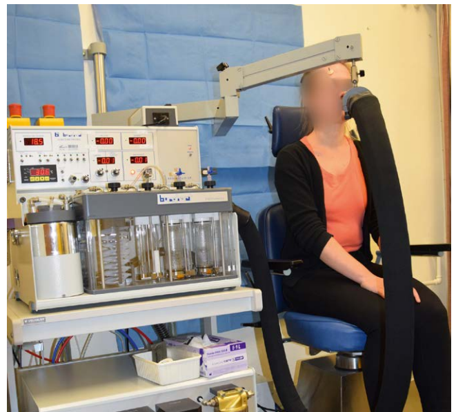
▶ Abb. 2 Versuchsaufbau Olfaktometer. Gesunde Probandin exemplarisch bei der Messung. Links im Bild das Olfaktometer. Die Duftstoffe werden über den Riechschlauch in die Nasenöffnung der Probandin appliziert.

Die statistische Auswertung erfolgte mit SPSS 22 (SPSS Statistics for Windows, Version 22.0. New York, IBM). Grafen wurden mit GrafPad Prism 7 erstellt (GrafPad Software Inc., La Jolla, USA). Um die Zielgrößen miteinander zu vergleichen und auf Unterschiede