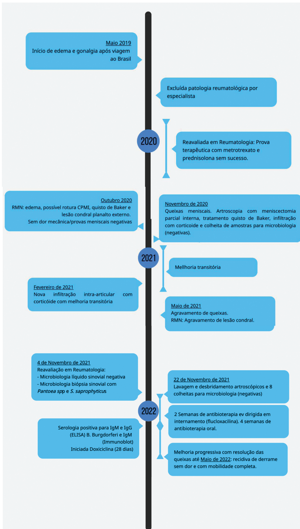
Fig. 1 Timeline da evolução do caso relatado.

Descrição: Evolução clínica desde o início do quadro. Destaca-se recidiva das queixas em Maio de 2022, mantendo derrame com impotência funcional e dor residuais em Agosto de 2022.