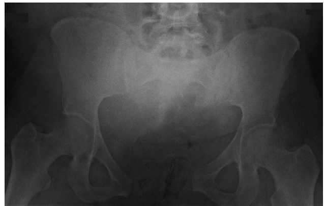
Fig. 1 Radiografia anteroposterior da pelve que evidencia disjunção da sínfise púbica com 7 cm de diástase.

A DSPP é uma condição incomum no cotidiano ortopédico e obstétrico, com incidência que varia de 1/30.000 a 1/300 gestações. 3 A investigação deve excluir cialgia, infecção geniturinária, TVP e inflamação da sínfise púbica. 5 No caso aqui relatado, o diagnóstico de DSPP só foi realizado depois da avaliação de outras três especialidades médicas.