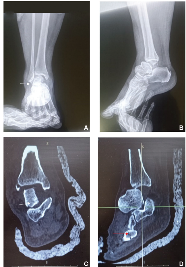
Fig. 2 Radiografias simples e imagens de tomografia computadorizada que mostram a luxação talar total (A,B). As setas brancas indicam a área da articulação talocalcânea devido à rotação do tálus. A seta vermelha aponta para a fratura na base do quinto metatarso.

A radiografia simples pós-operatória não mostrou evidências de fratura do colo ou do corpo do tálus. A paciente foi novamente avaliada quinze dias após a cirurgia. Não obser-