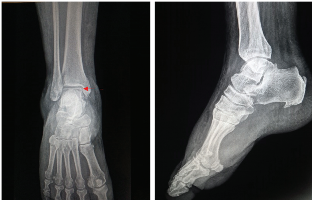
Fig. 4 As imagens radiográficas revelaram o sinal de Hawkins seis semanas após a cirurgia (seta vermelha). Não observamos esclerose ou colapso ósseo da cúpula talar.