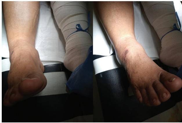
Fig. 1 Imagem clínica que mostra o edema do tornozelo e a ferida cutânea.

Diversos autores 7,8 já recomendaram a redução aberta da LTT; no entanto, a redução fechada precoce de luxações fechadas do tálus tem sido enfaticamente recomendada para evitar lesões nos tecidos moles e danos à rede de suprimento sanguíneo. 9