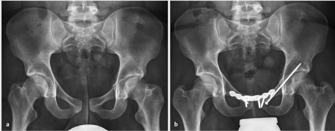
► Abb. 3 a 23-jähriger Patient mit traumatischer Symphysensprengung sowie lateraler Schambeinastfraktur links. Indikation zur Implantation einer Symphysenplatte sowie Kriechschraube bei instabiler Beckenringfraktur. b Postoperativer Zustand aus ► Abb. 3 a . Über einen Pfannenstiel-Zugang erfolgte die Implantation der Symphysenplatte, dann Aufsuchen des Eintrittspunktes und Implantation der Kriechschraube.