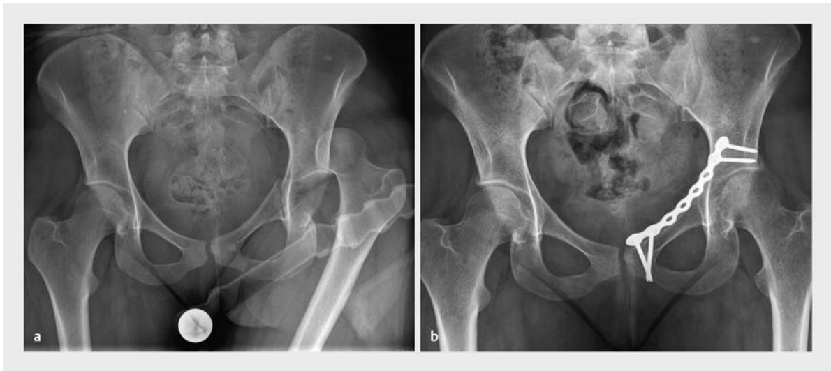
► Abb. 2 a 19-jährige Patientin mit hinterer Hüftluxation und vorderer Pfeilerfraktur des Azetabulums. Indikation zur Plattenosteosynthese des Azetabulums über einen Stoppa-Zugang. b Postoperatives Röntgenbild aus ► Abb. 2 a erfolgte Implantation einer Azetabulumplatte zur Versorgung einer vorderen Pfeilerfraktur über den Stoppa-Zugang.

beinastes möglich. Auch ein Eingehen in das kleine Becken ist in der Schicht zwischen präperitonealem Fettgewebe und M. obturatorius internus möglich.