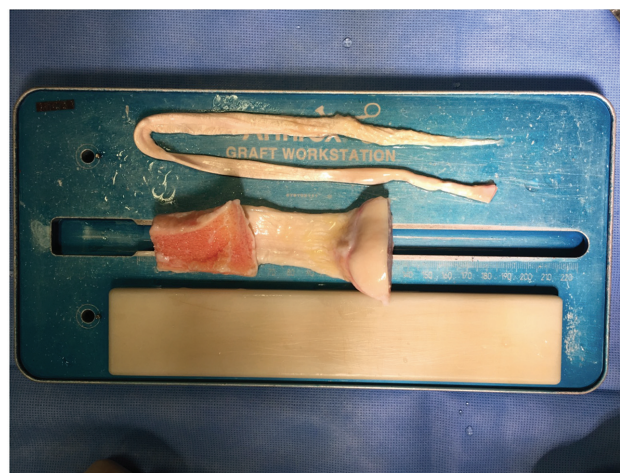
Fig. 1 Foto de aloenxertos prontos para serem preparados. Observam-se enxerto com parte óssea (Patelar) e sem partes ósseas (Tibial Posterior).

O estudo de coorte prospectivo realizado por Kaeding et al. 13 avaliou o número de variáveis para determinar preditores da ruptura do enxerto nos 2 anos após a reconstrução. Uso de aloenxerto e idade jovem aumentaram